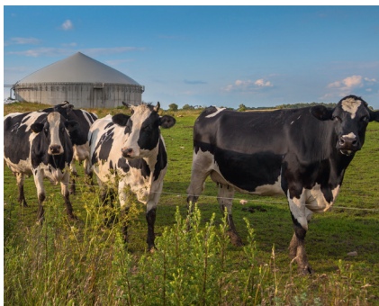
Le programme PEPIT Auvergne-Rhône-Alpes « nourrir les troupeaux et les méthaniseurs » (Chambre Régionale d'Agriculture Auvergne-Rhône-Alpes, Arvalis : institut du végétal, Idele : institut de l'élevage)