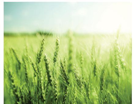
Plateforme d'essais couverts végétaux en réseau de producteurs suivi par le Centre de Développement de l'Agroécologie