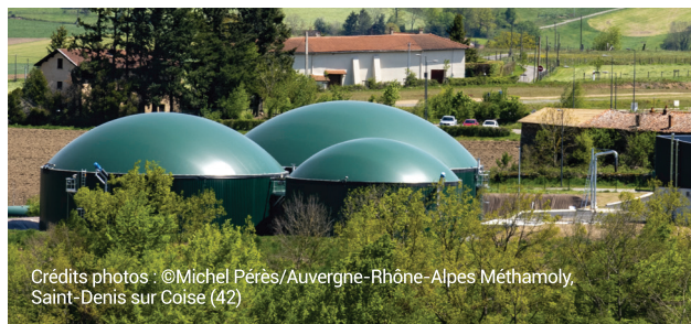
Crédits photos : ©Michel Pérès/Auvergne-Rhône-Alpes Méthamoly, Saint-Denis sur Coise (42)

En fonction de l'espèce choisie, des CIVE bien conduites, comme d'autres types de cultures intermédiaires, permettent :