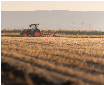
Expérimentations Coopératives Dauphinoise et Terre d'Alliances