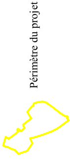
Annexe 5 : Plan des abords du projet sur fond de photographie aérienne Echelle approximative 1 / 3 450