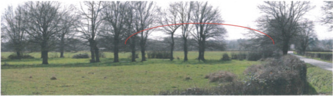
Photo 4 : Vue lointaine du site depuis le hameau des Gandoux au nord-est

Le projet se trouve au fond de la photo, sous le trait rouge. Il est caché derrière les arbres du bocage environnant.