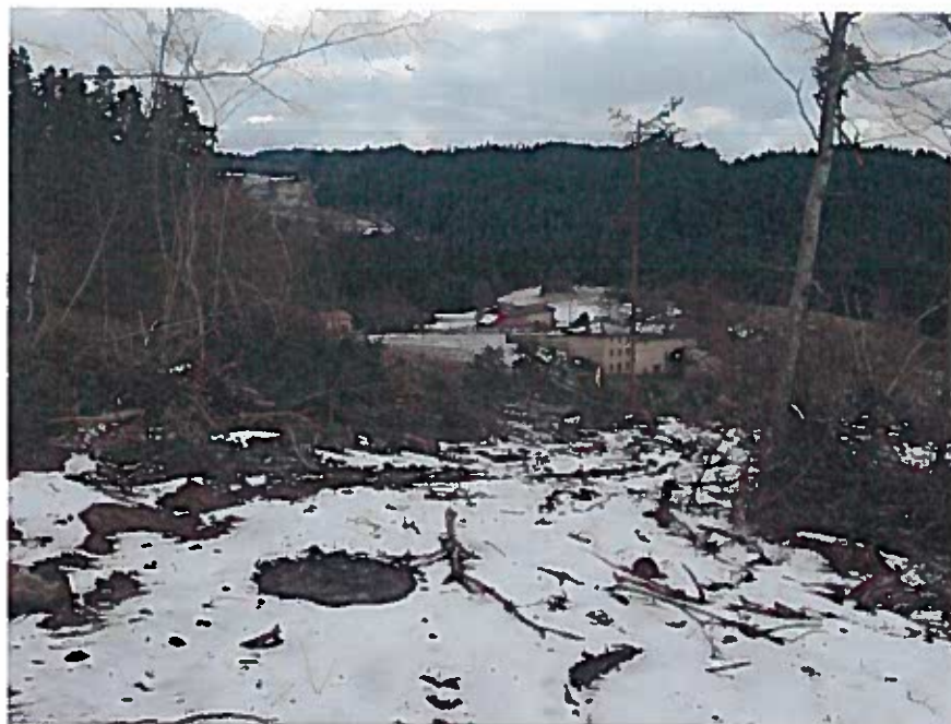
Vue de la parcelle sur le village.