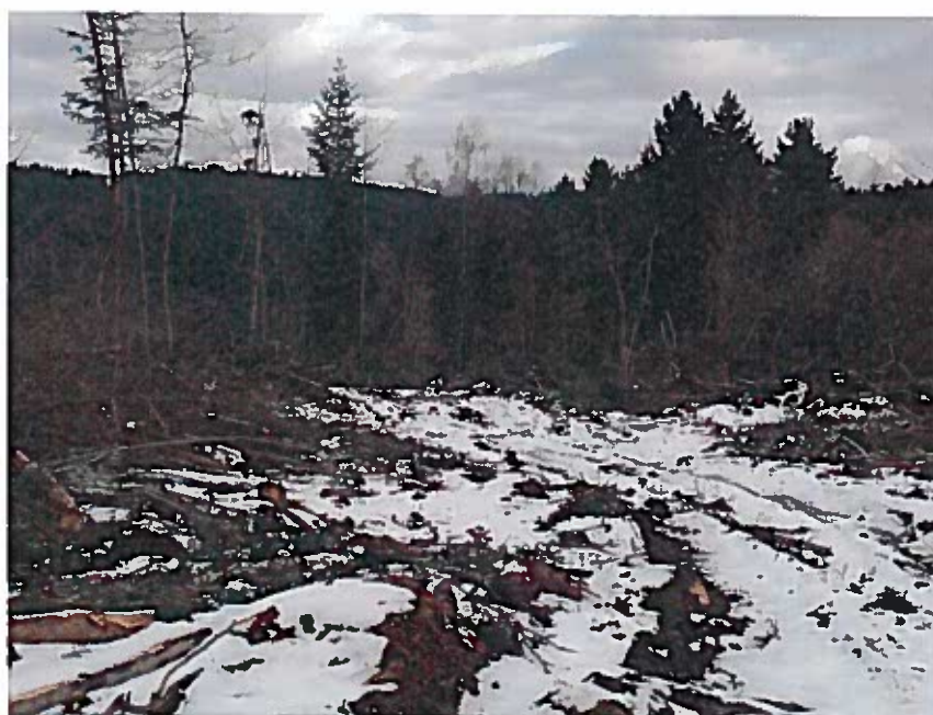
Vue au milieu de la parcelle après coupe.