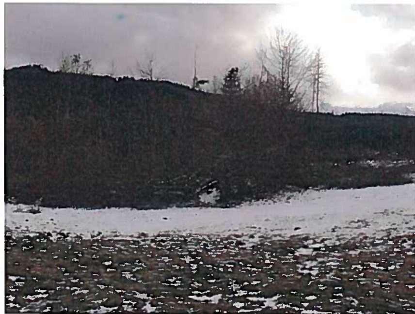
Vue de la parcelle à dessoucher depuis la prairie voisine exploitée par l'agriculteur.