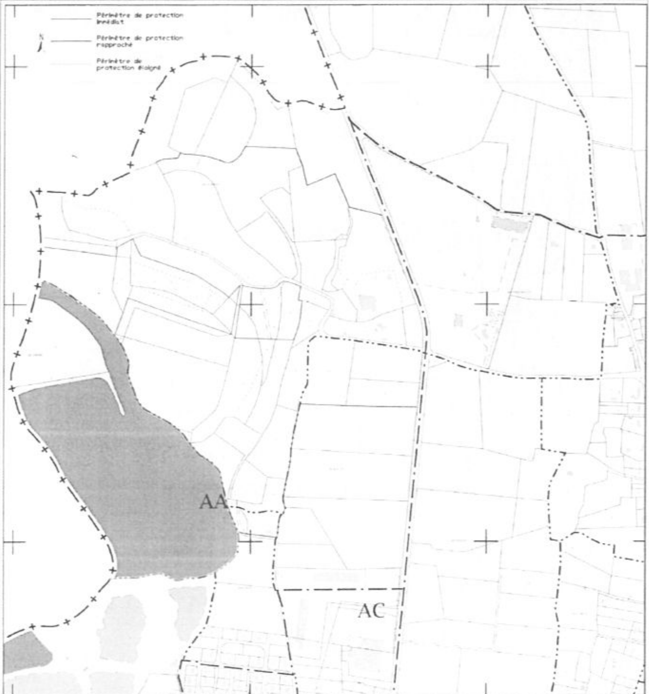
Délimitation des périmètres de protection de captage