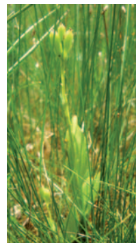
le Liparis de Loesel

Il s'agit d'une orchidée de petite taille (de 6 à 25 cm), de couleur entièrement verte hormis ses fleurs, grappe lâche de 2 à 15 petites fleurs jaune verdâtre (6-7mm de long). La floraison se produit (en juin et juillet) lorsque les réserves nutritives sont suffisantes (parfois tous les cinq ans seulement).