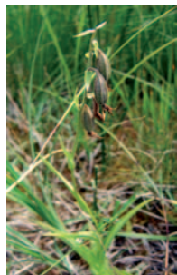
Epipactis des marais