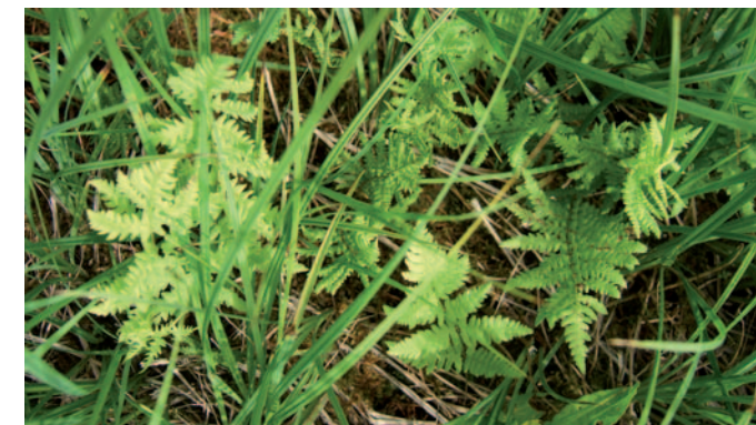
Fougère des marais