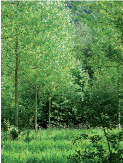
Au cœur du site, entre prairies humides et peupleraies

mais il est vraisemblable que les populations d'amphibiens soient bien développées et que ces zones humides constituent une halte intéressante pour l'avifaune migratrice.