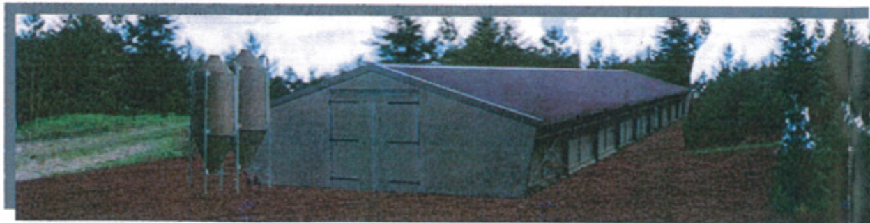
Bâtiment avicole couleur bardage ral 1019 et couverture ral 8012

Avicole projeté Monsieur Rivière Clément