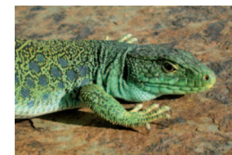
Lézard ocellé ( Lacerta lepida )