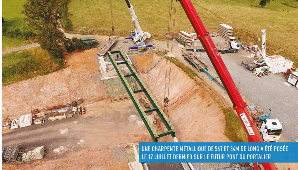
UNE CHARPENTE MÉTALLIQUE DE 56T ET 34M DE LONG A ÉTÉ POSÉE LE 17 JUILLET DERNIER SUR LE FUTUR PONT DU PORTALIER

La 2 ème phase de l'opération a débuté avec la construction des trois principaux ouvrages d'art de la déviation de Sansac. Les travaux sont réalisés par le groupement Eiffage-Matière.