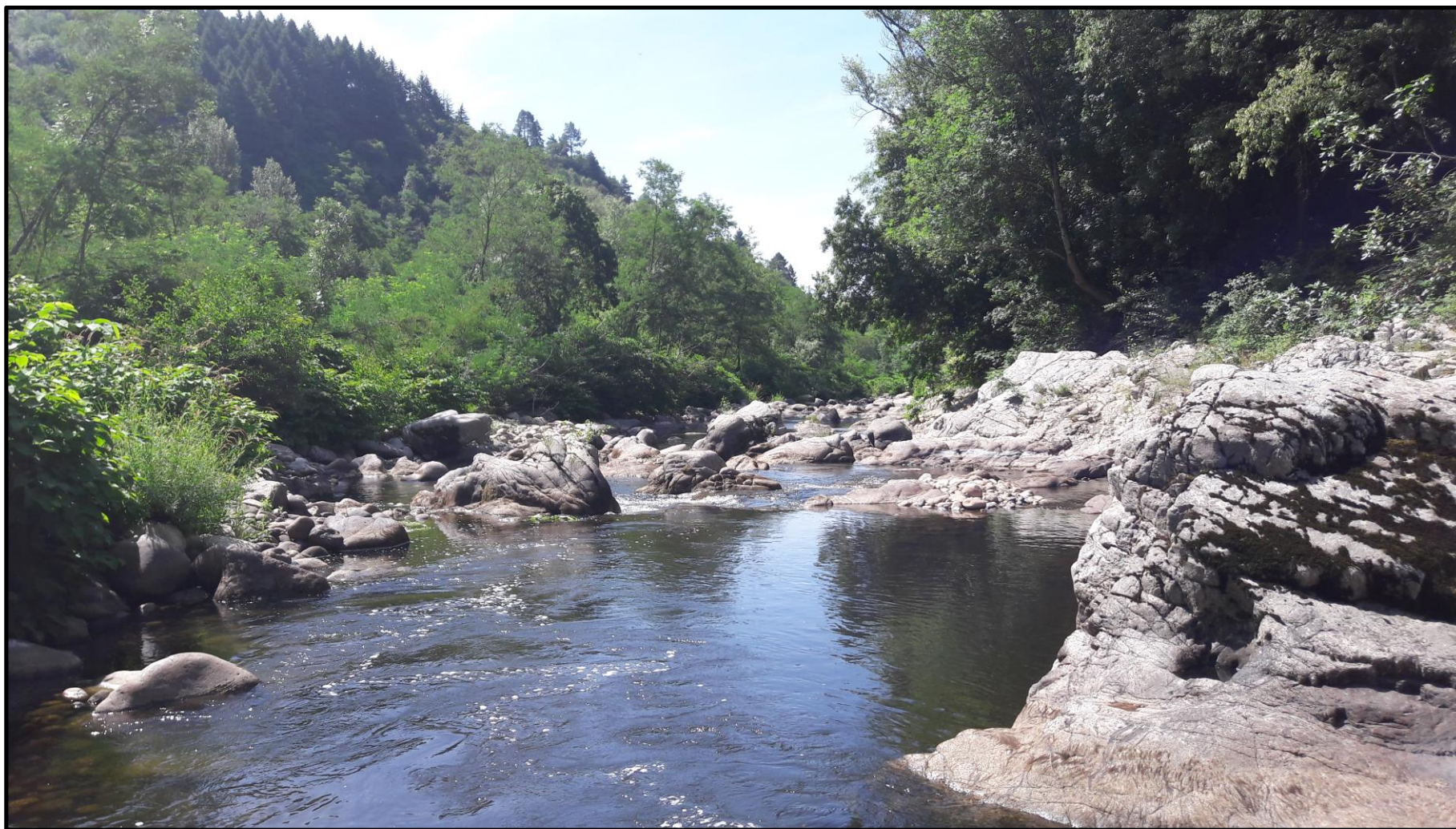
Figure 4 : Partie amont du TCC de la MCHÉ de la Roche