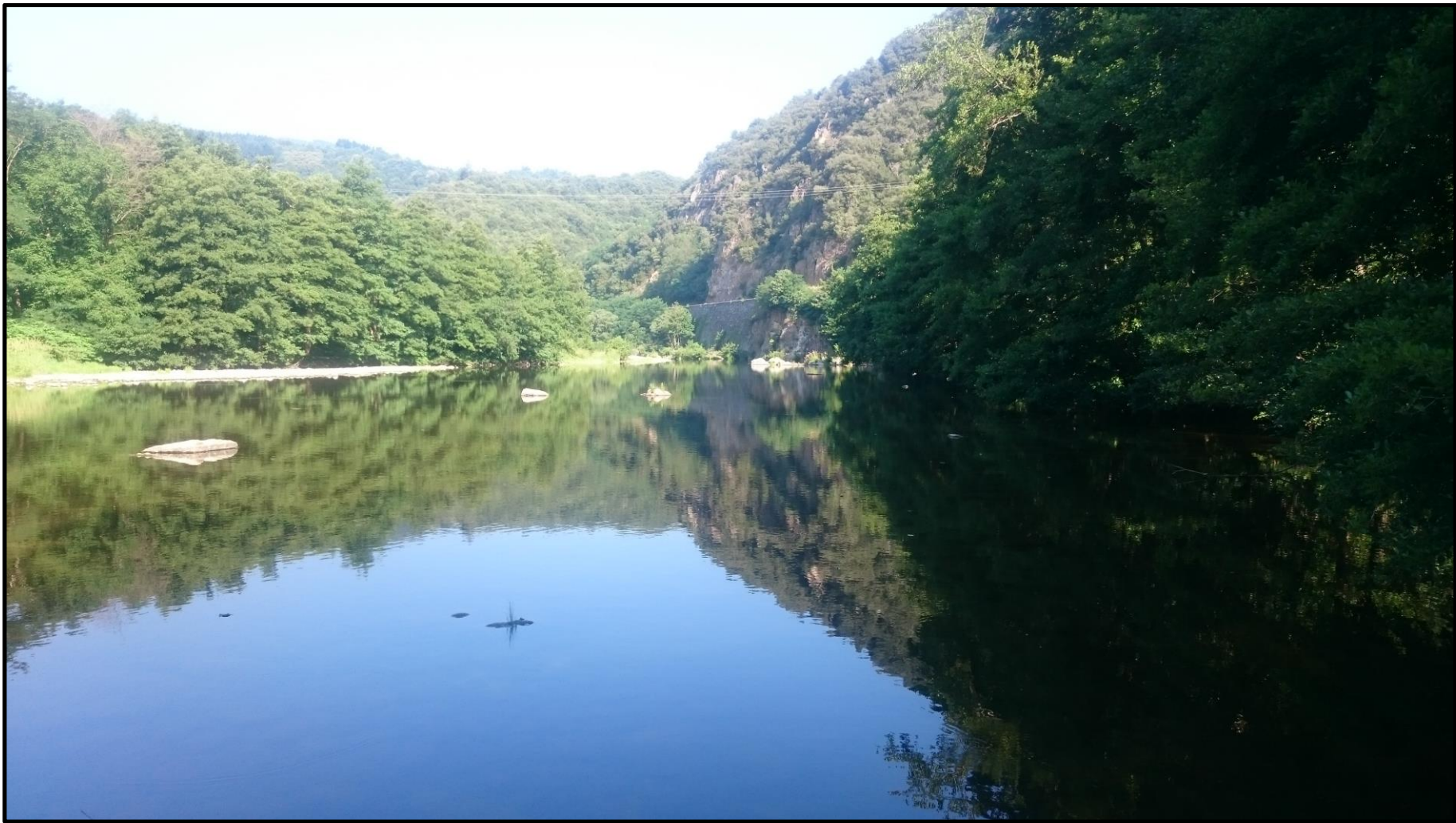
Figure 8 : Retenue d'eau créée par l'ancien barrage