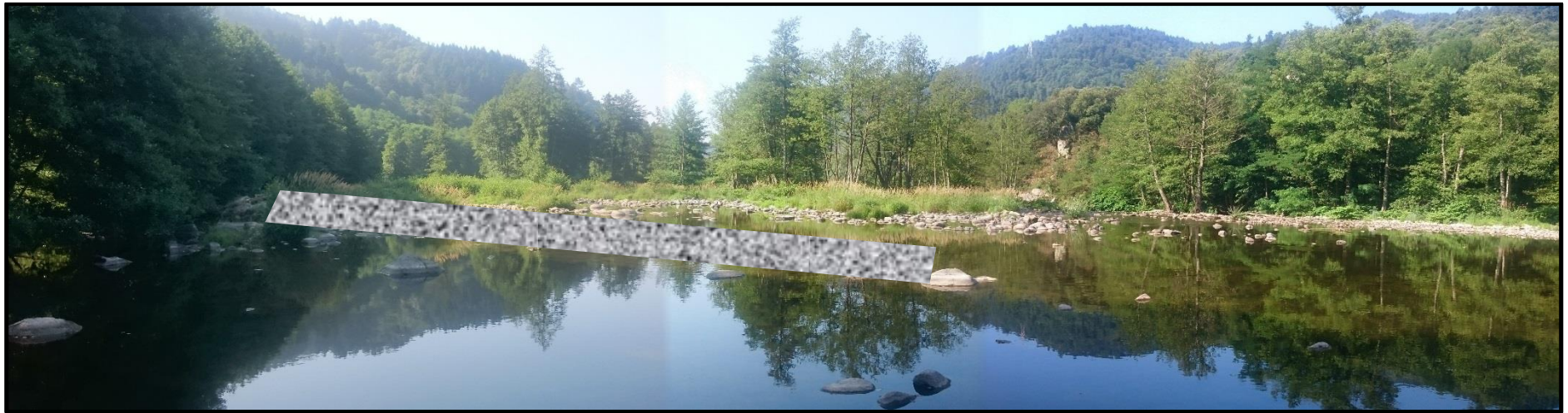
Figure 7 : Enrochement réalisé sur l'ancien emplacement du barrage de la MCHÉ de la Roche