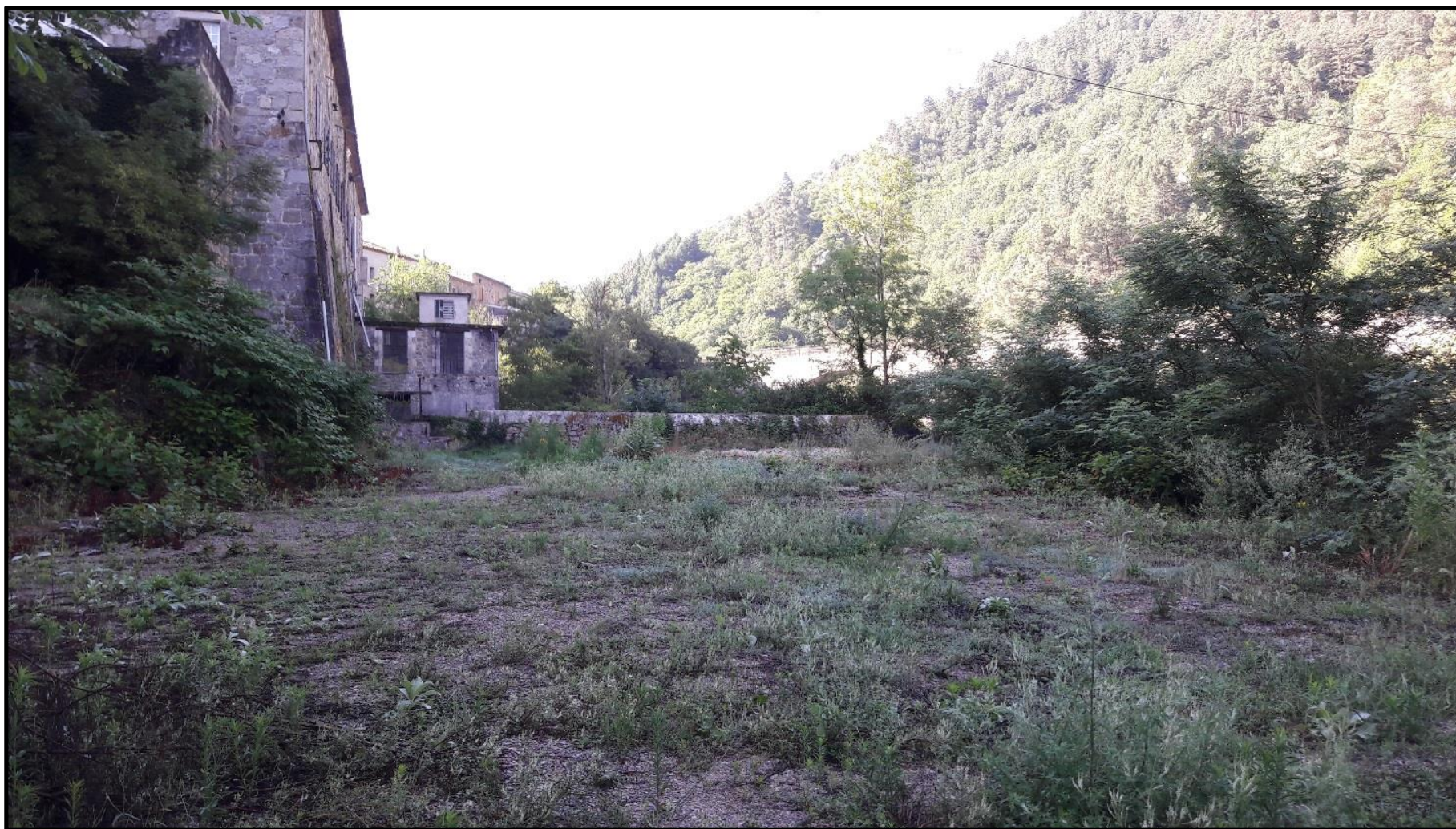
Figure 1 : Bâtiment actuel de la MCH de la Roche