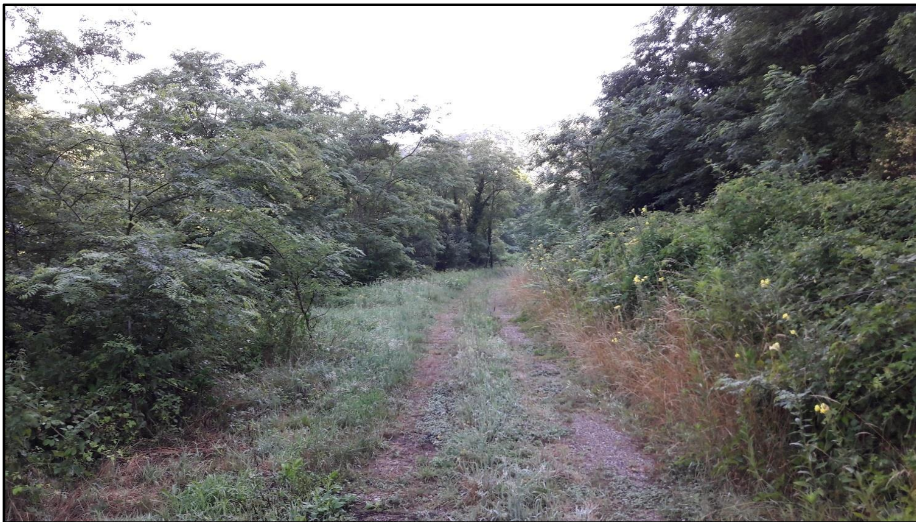
Figure 5 : Chemin de halage de la MCHÉ de la Roche