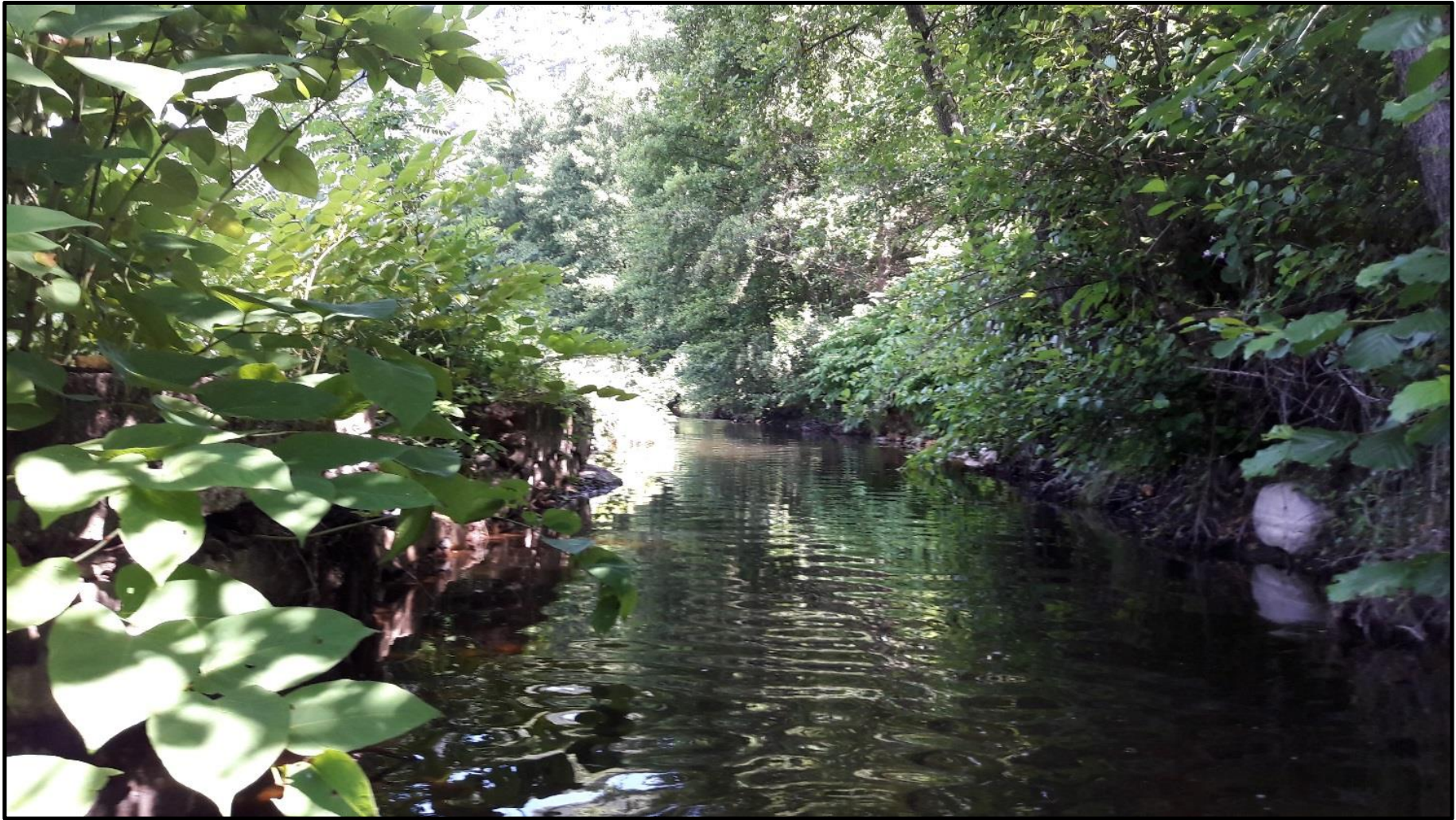
Figure 3 : Canal de la MCHÉ de la Roche