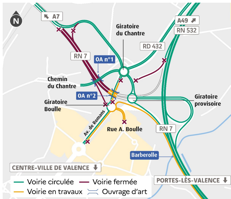
Carrefour des Couleurs - configuration à partir du 11/01/2024

À compter du 11 janvier, les usagers emprunteront une partie de ce barreau de liaison et passeront sous l'ouvrage d'art n°2.