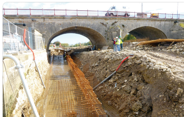
Construction de la passe à poissons du barrage de Gray, octobre 2013 (opération de VNF)

Dans chacun des 14 départements un arrêté préfectoral définit l'organisation de la police de l'eau et précise le périmètre de compétence de la DREAL Auvergne-Rhône-Alpes.