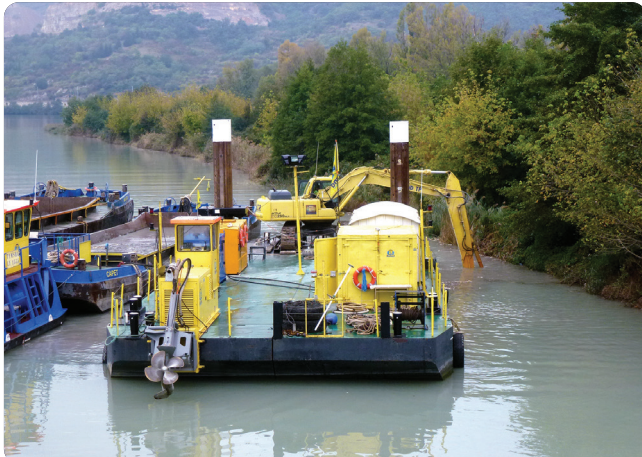
Contrôle du dragage de la Drôme aval, octobre 2013 (opération CNR)

Les missions de la police de l'eau sur l'axe Rhône Saône comprennent :