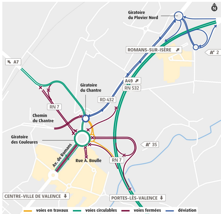
Conditions de circulation les nuits des 22 et 23 février 2023