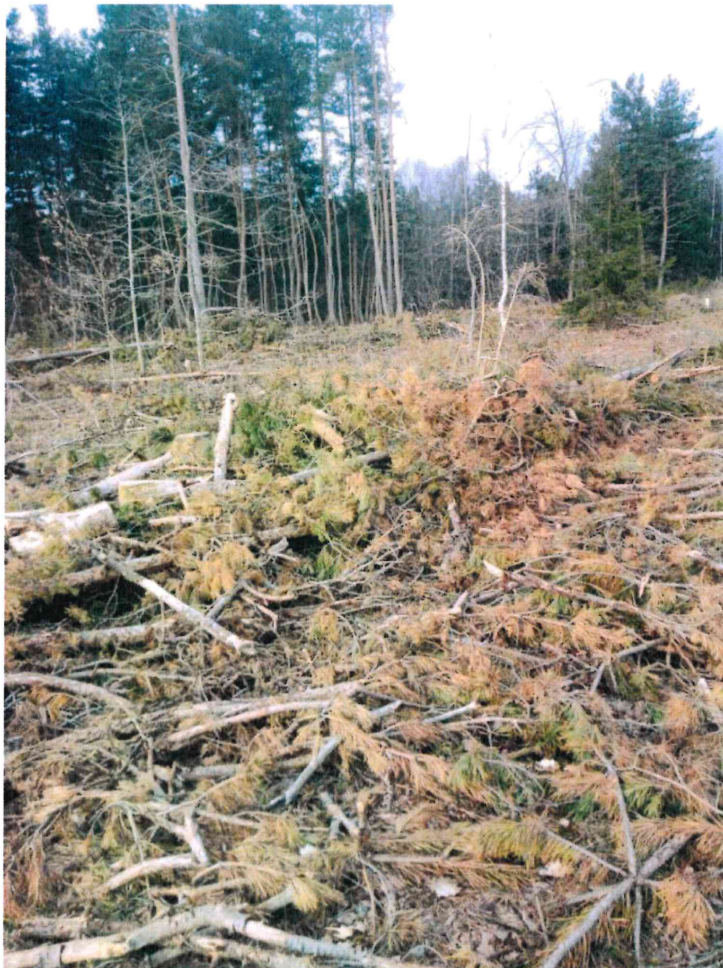
Parcelle E 511