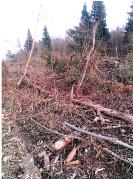
Parcelle E 1180 à E 1183