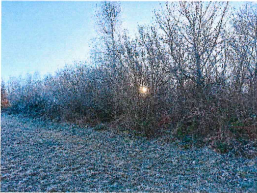
La Celle – AN 61 – 0.4215 Ha et AN 62 – 0.2560 Ha