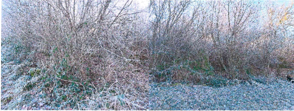
La Celle – AP 133 – 0.5240 Ha