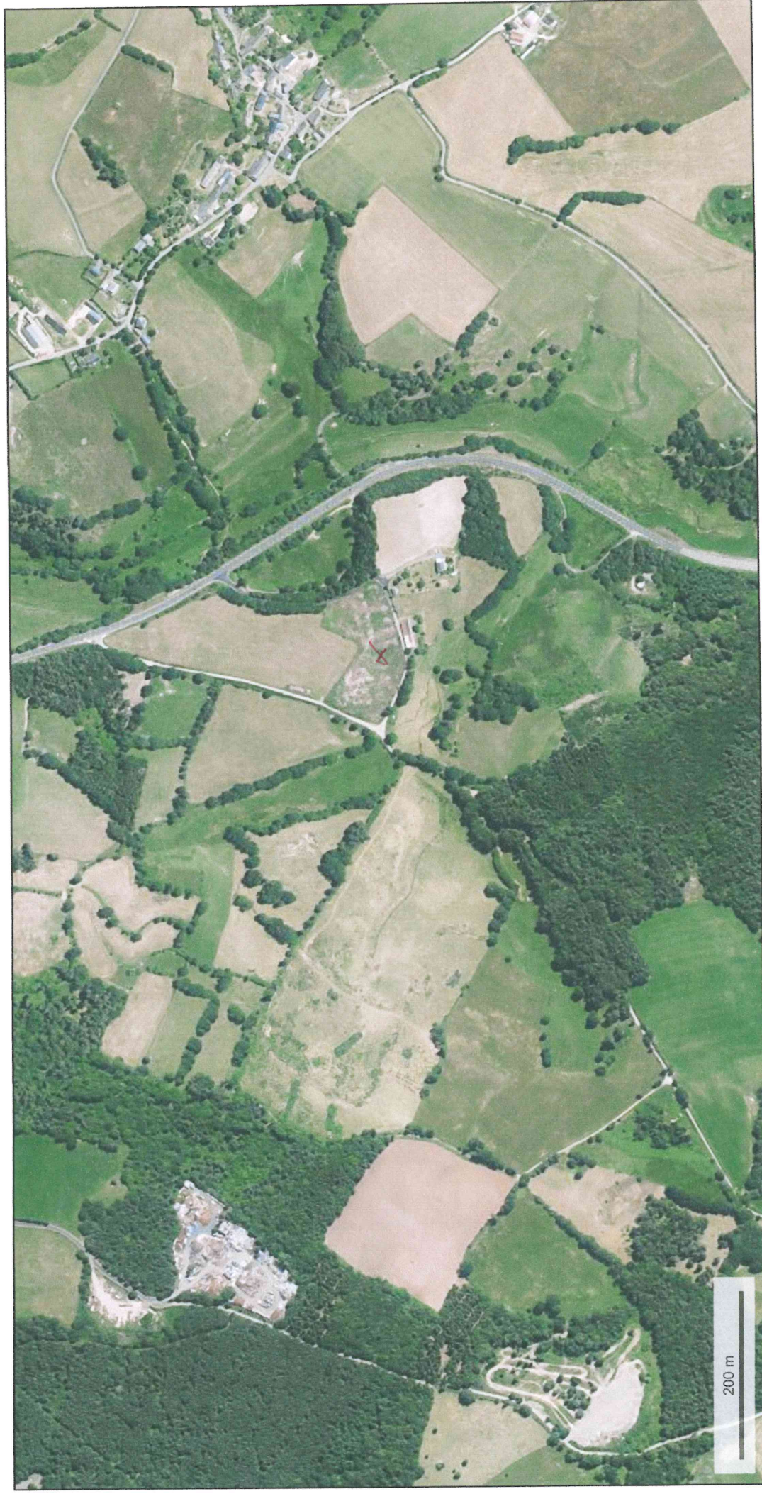
Photo aérienne 2013

© IGN 2021 - www.geoportail.gouv.fr/mentions-legales