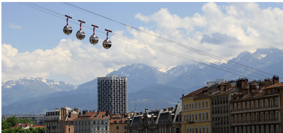
Téléphérique de Grenoble Bastille

Depuis 2006, l'agglomération grenobloise est dotée d'un PPA mais l'évaluation du deuxième PPA (période 2014/2018) a montré l'importance d'en élaborer un nouveau, encore plus ambitieux, pour mettre en place des actions efficaces ciblant les causes de la pollution de l'air.