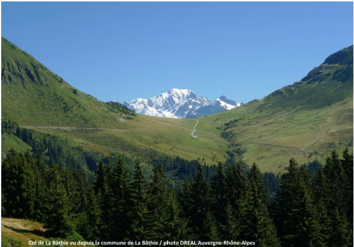
Col de La Bâthie vu depuis la commune de La Bâthie

Ce site est bien plus grand que simplement le col et les lacs. Il s'agit en réalité de deux vallées confluentes surplombant la vallée de la Tarentaise. C'est leur état de préservation exceptionnel, ainsi que la diversité des paysages de haute et de moyenne montagne auxquels elles servent d'écrin qui leur a valu cette reconnaissance au niveau national. Le critère de classement retenu par le Conseil d'État est en effet leur caractère "pittoresque", c'est à dire digne d'être peint.