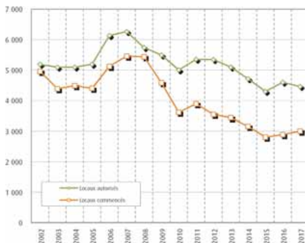
La construction neuve de locaux

Données annuelles glissantes Auvergne-Rhône-Alpes actualisées 2 ème trimestre 2017