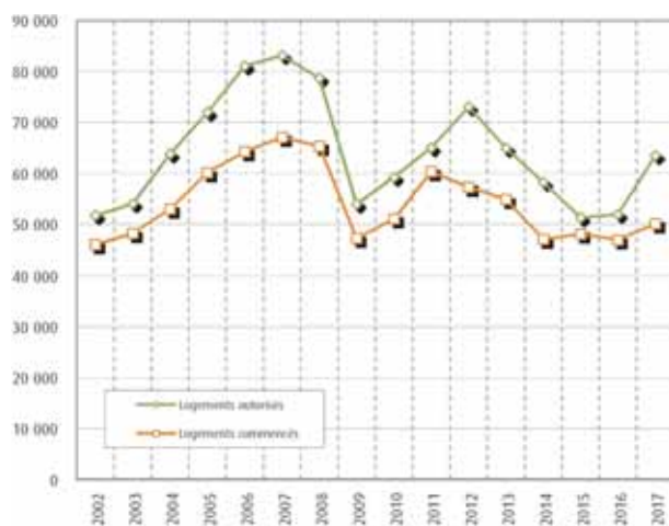
La construction neuve de logements

La croissance des mises en chantier est moins importante que celle des autorisations. 50 100 logements sont commencés au cours de la dernière année glissante, en hausse de 7 % par rapport à la même période de 2016. Traduisant une tendance incertaine, le nombre de logements mis en chantier au 2 ème trimestre 2017 est inférieur de 3 % à celui du 2 ème trimestre 2016. En année glissante, l'individuel pur progresse sensiblement de 18 %. Les mises en chantier d'appartements sont en hausse de 3 %, l'individuel groupé reste d'un niveau inchangé.