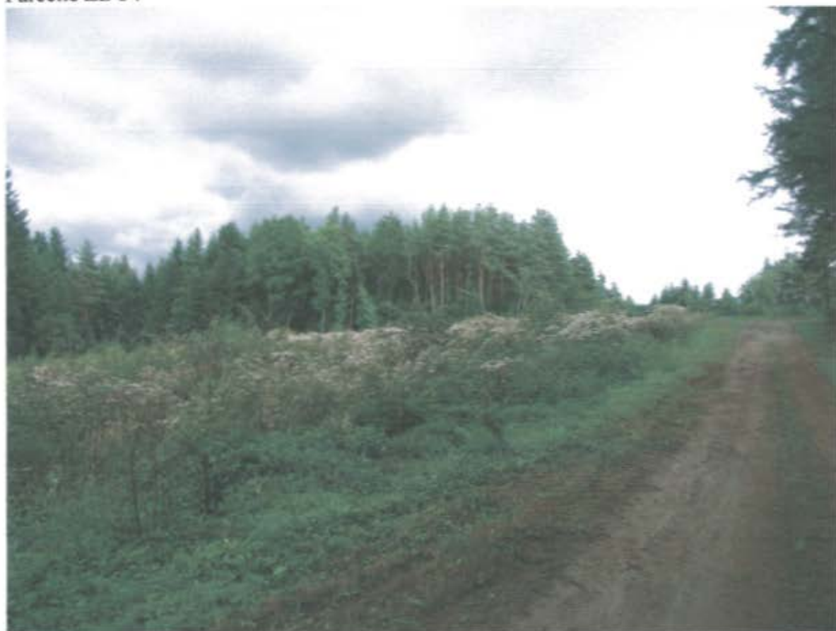
Parcelle ZB 34