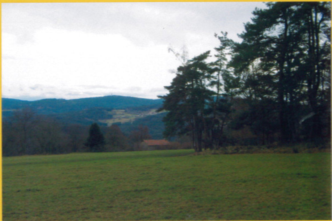
Vue depuis la parcelle AL 151 sur les parcelles AL 192 (à défricher) et la parcelle AL 195 en culture