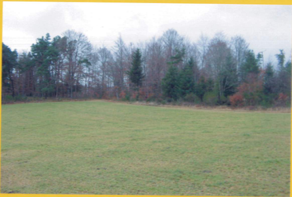
↑ Vue depuis la parcelle AL 151 sur la parcelle AL 192 ↑ et la parcelle AL 191