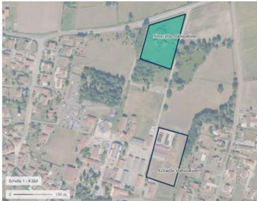
Lieu prévu pour installer la nouvelle stabulation