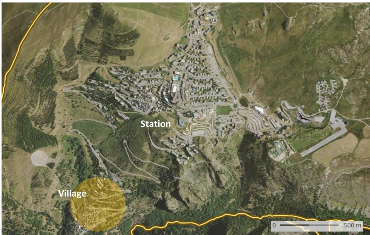
Commune d'Huez – village – station

D'un point de vue environnemental, 38 % du territoire communal est concerné par des zones réglementaires et d'inventaires naturalistes :