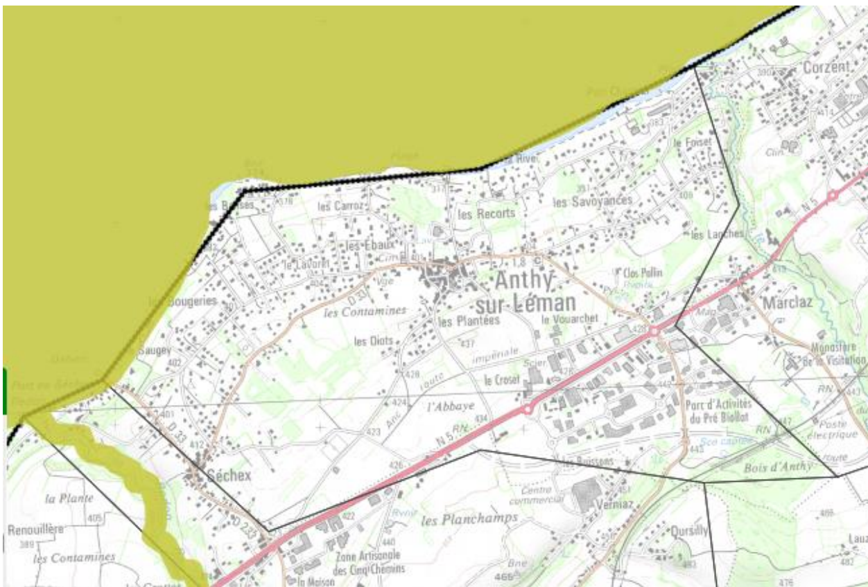
Localisation ZICO – fond de carte georhonealpes.fr