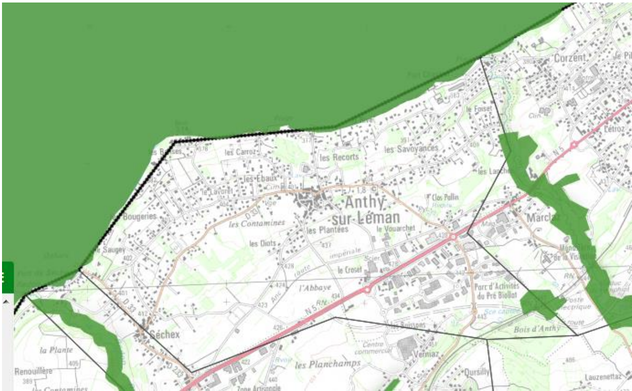
Localisation des ZNIEFF T1