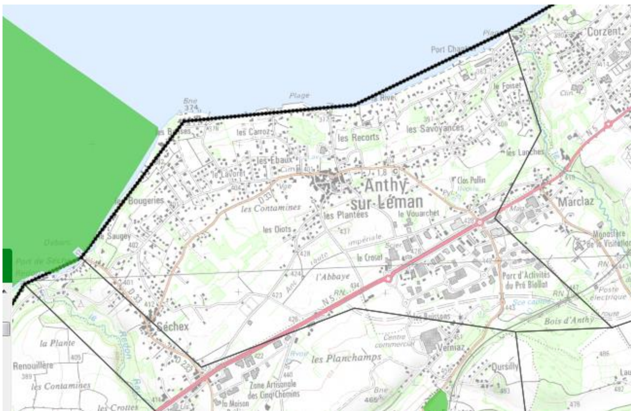
Localisation sites Natura 2000 – fond de carte georhonealpes.fr