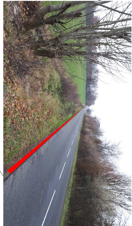
Projet : passage sur accotement Nord Difficulté : accotement étroit + fosse profond