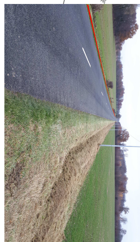
Projet : passage sur accotement Nord Difficulté : fosse profond + haie d'arbres