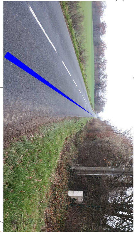
Passage sous voirie : accotements étroits + fossés profonds