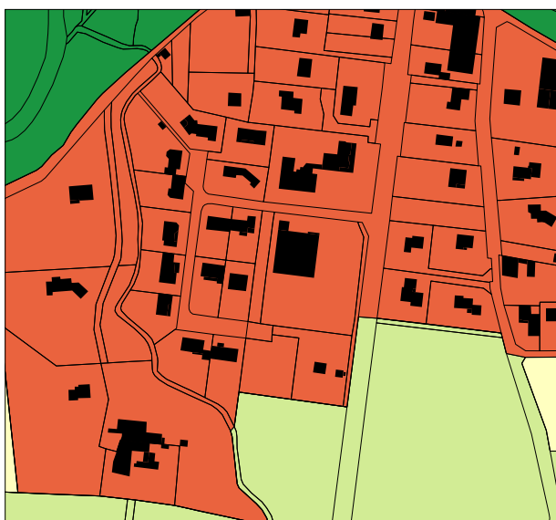
Zone UB avant modification

Il convient de souligner que le projet du magasin UTILE se réalise sur une parcelle déjà urbanisée, sans extension de l'enveloppe bâtie et sans augmentation de l'imperméabilisation / artificialisation des sols.