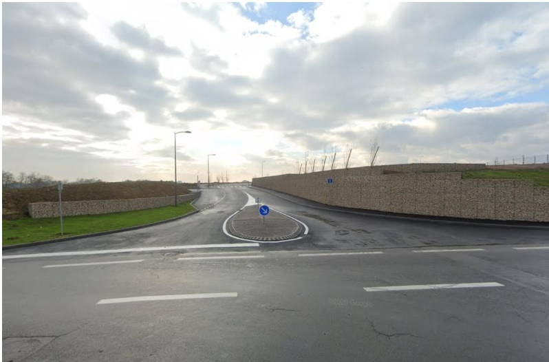
Accès à la zone 1AUib.