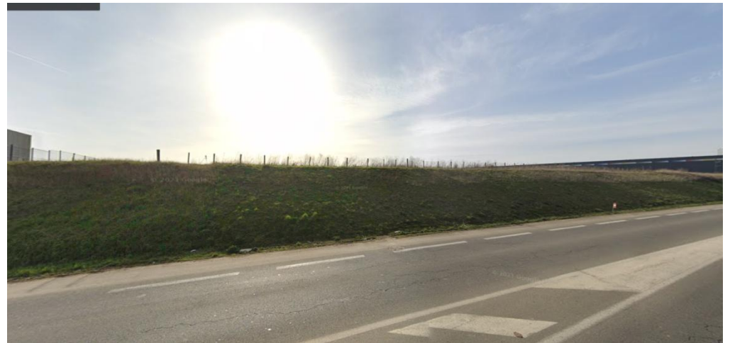
Vue depuis la RD339 (Lybertec au fond à droite)