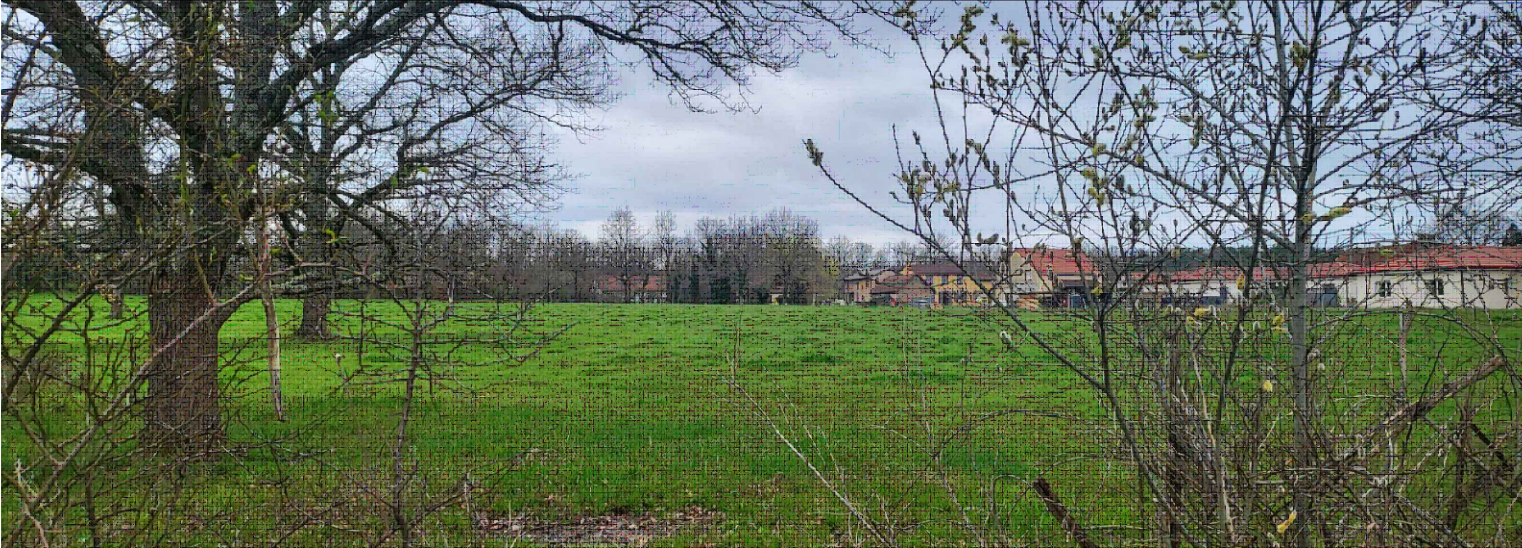
Vue proche 2: Depuis le lotissement (mars 2024)