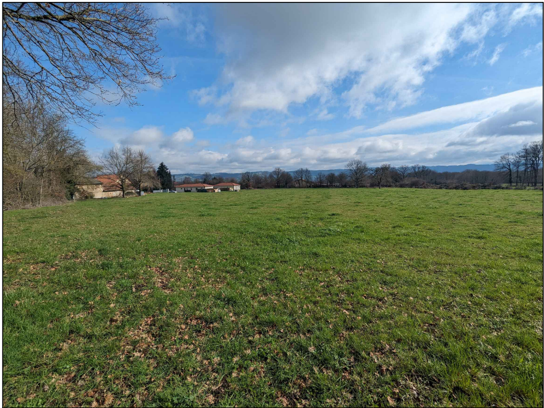
Vue proche 1: Depuis la limite de parcelle à l'Ouest (mars 2024)