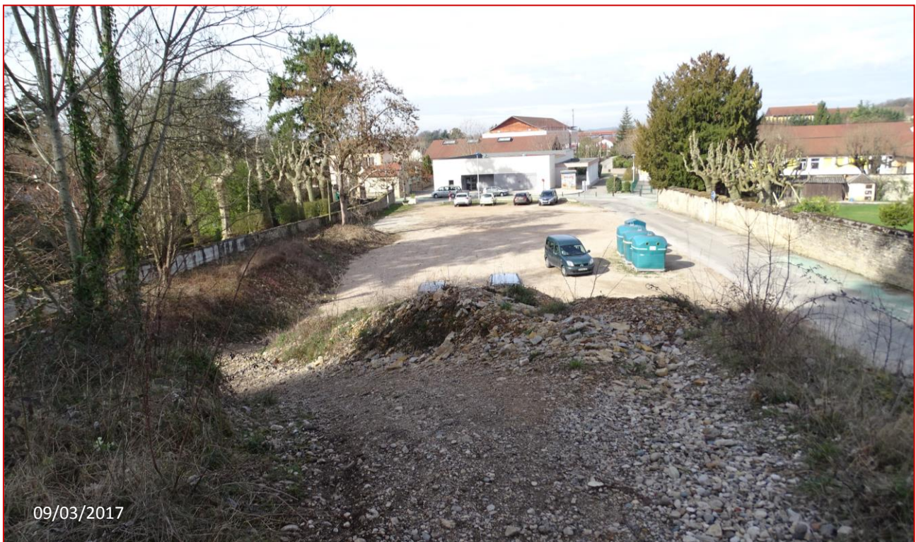
A – Crémieu : origine du projet de ligne verte et site d'implantation de l'aire de stationnement