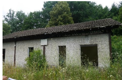
Bâtiment existant sur le site

Historiquement occupé par un camping, le site a été modelé pour cette ancienne activité. Une série de cheminements carrossables ou non, traités en enrobé ou terre battue sont existants sur le site, une large zone ne contient pas d'arbres au sud du terrain. Un bâtiment abritant les anciens sanitaires est présent sur le site. Ce bâtiment est maçonné, de dimensions 7 x 14 m et surmonté d'un toit à deux pentes en tuiles.