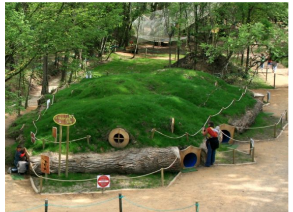
Le parcours semi obscur