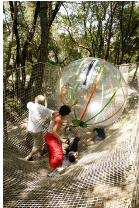
Les mers de filets