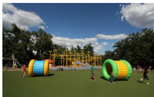
Le parc à cylindres