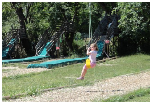
Les tyroliennes géantes