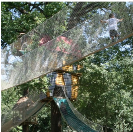
Les cabanes perchées

Le projet d'aménagement prévoit la mise en place d'attractions telles que :