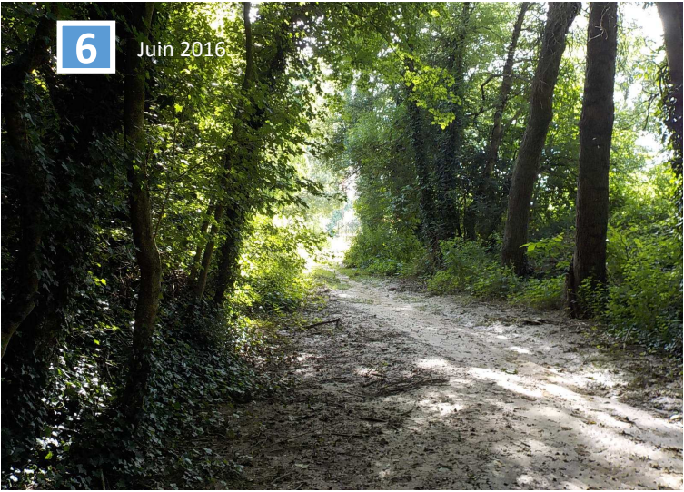
Chemin aval (implantation cuve de collecte)