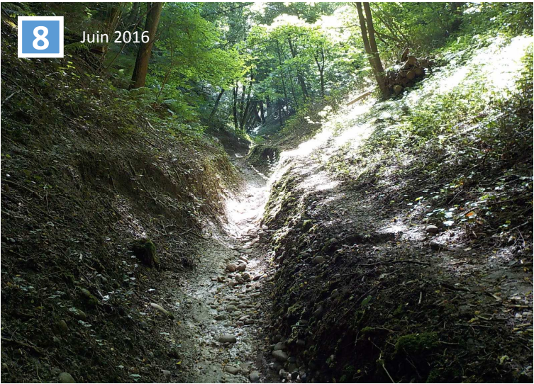
Chemin amont, zones d'érosion (implantation micro- barrages)

GENAY - TALWEG DE LAY Création d'aménagements de lutte contre les inondations et le ruissellement agricole PLANCHES PHOTOGRAPHIQUES Direction de l'Eau Service Etudes