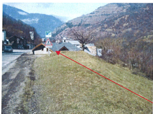
Zone bâtie de Vignotan