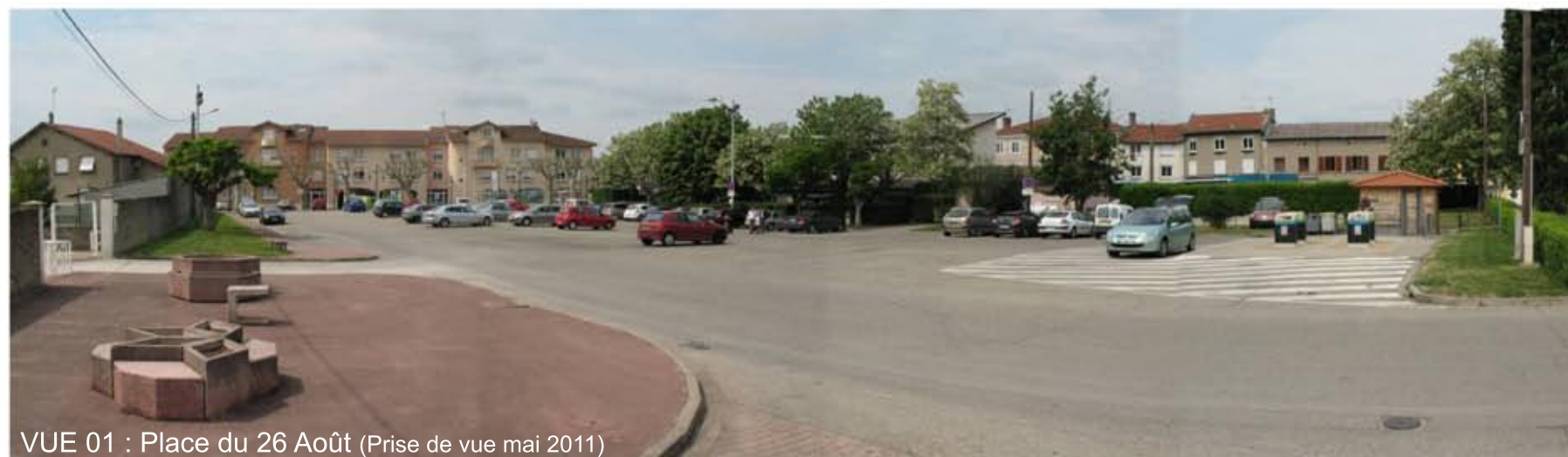
VUE 01 : Place du 26 Août (Prise de vue mai 2011)