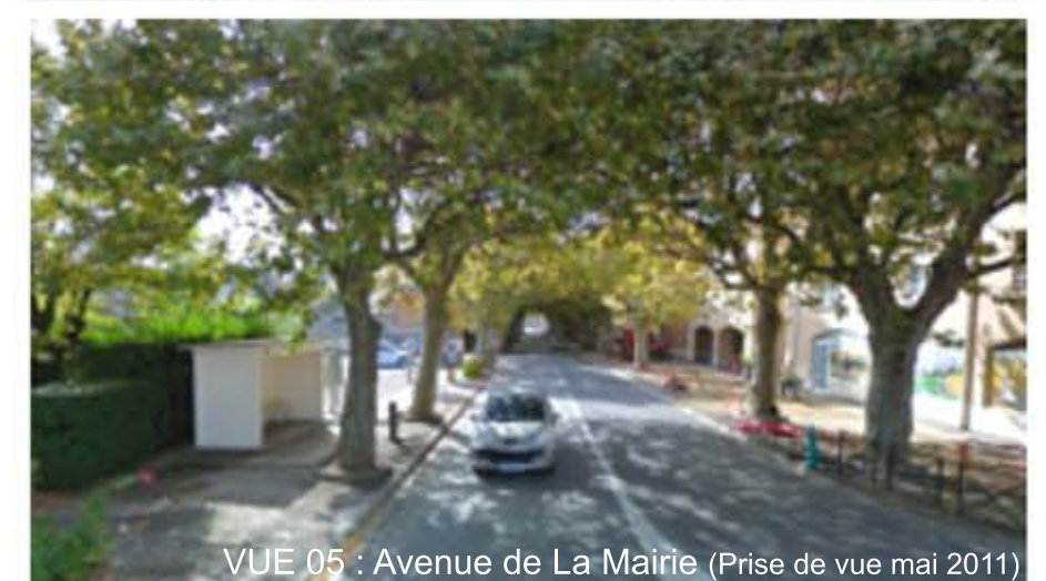
VUE 05 : Avenue de La Mairie (Prise de vue mai 2011)