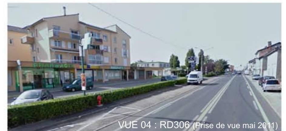
VUE 04 : RD306 (Prise de vue mai 2011)