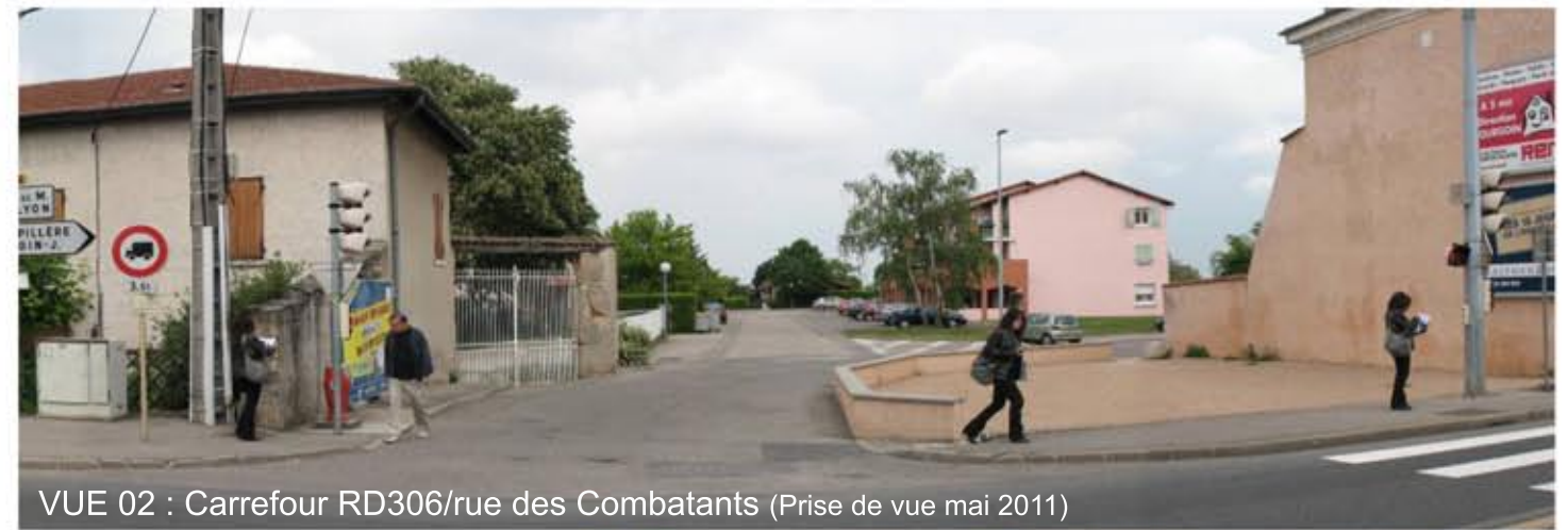
VUE 02 : Carrefour RD306/rue des Combattants (Prise de vue mai 2011)