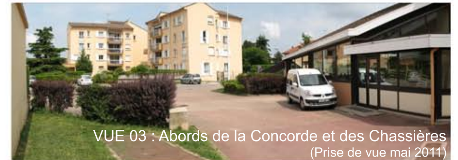
VUE 03 : Abords de la Concorde et des Chassières (Prise de vue mai 2011)