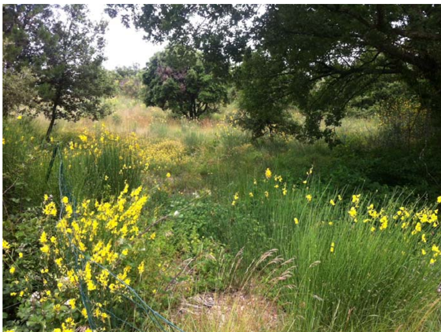
Cliché 4 - juillet 2013