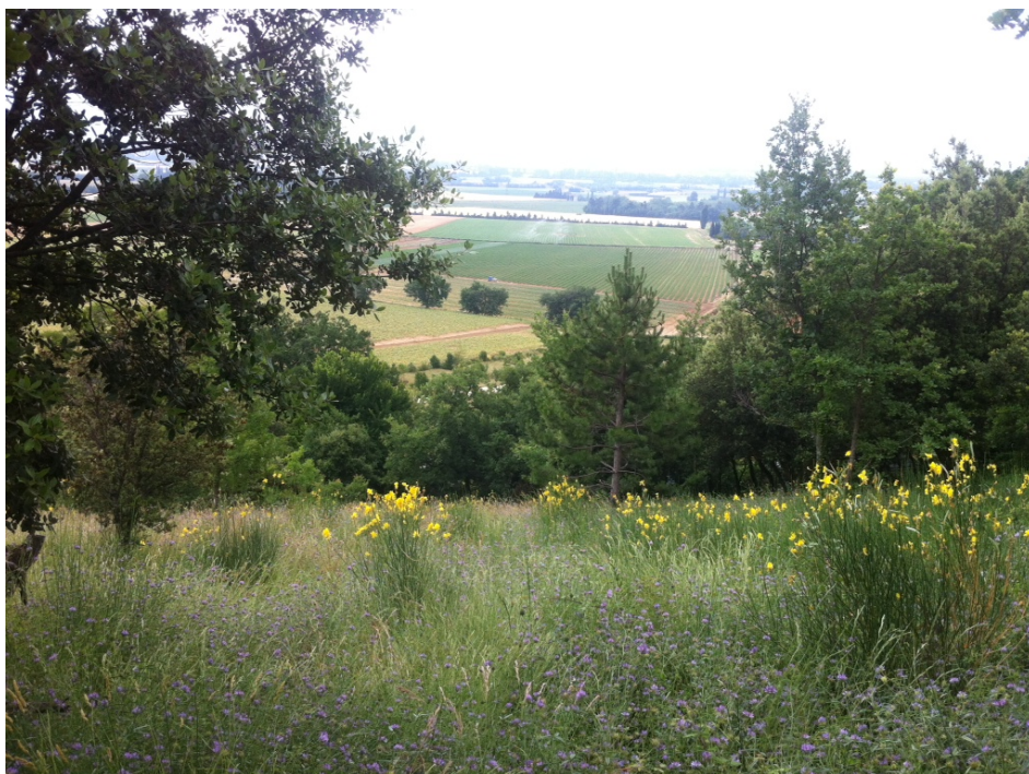
Cliché 2 - juillet 2013