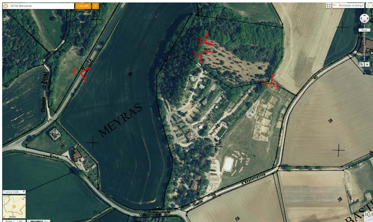
Localisation des clichés