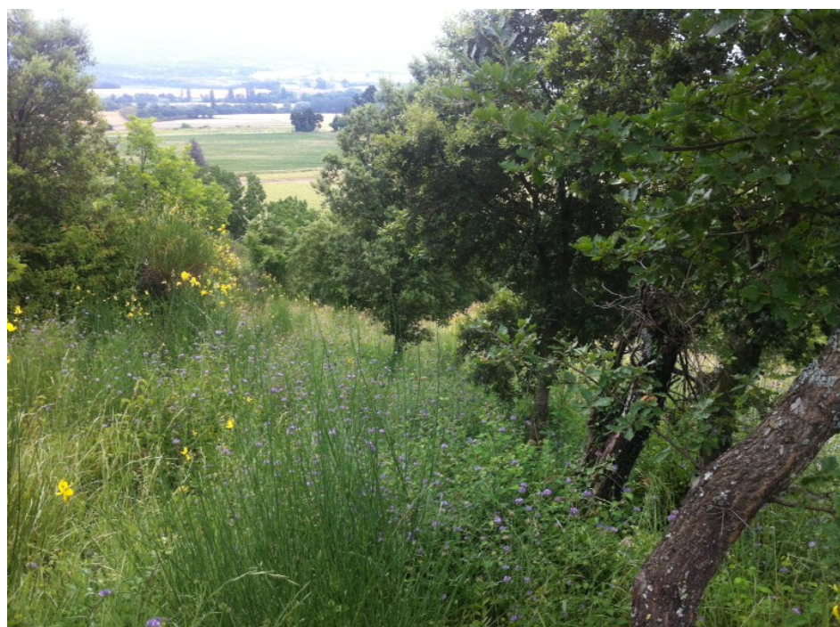
Cliché 3 - juillet 2013