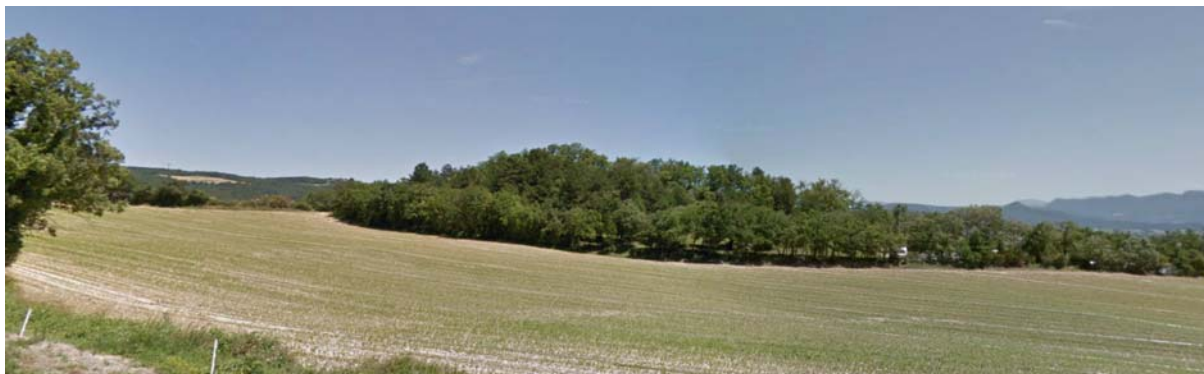
Cliché 1 juin 2012 - Vue depuis la RD 105