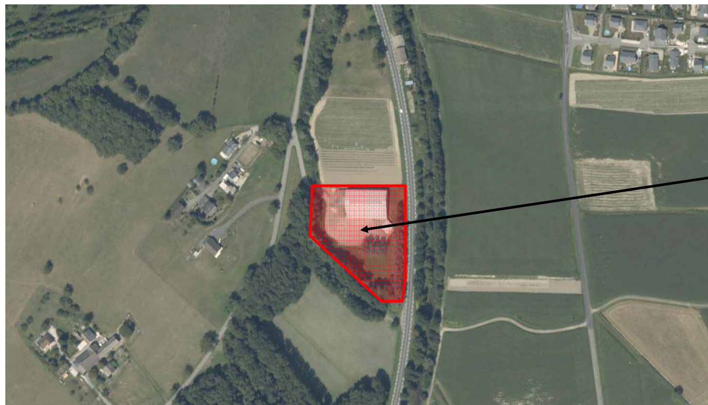
Vue aérienne. Sans échelle