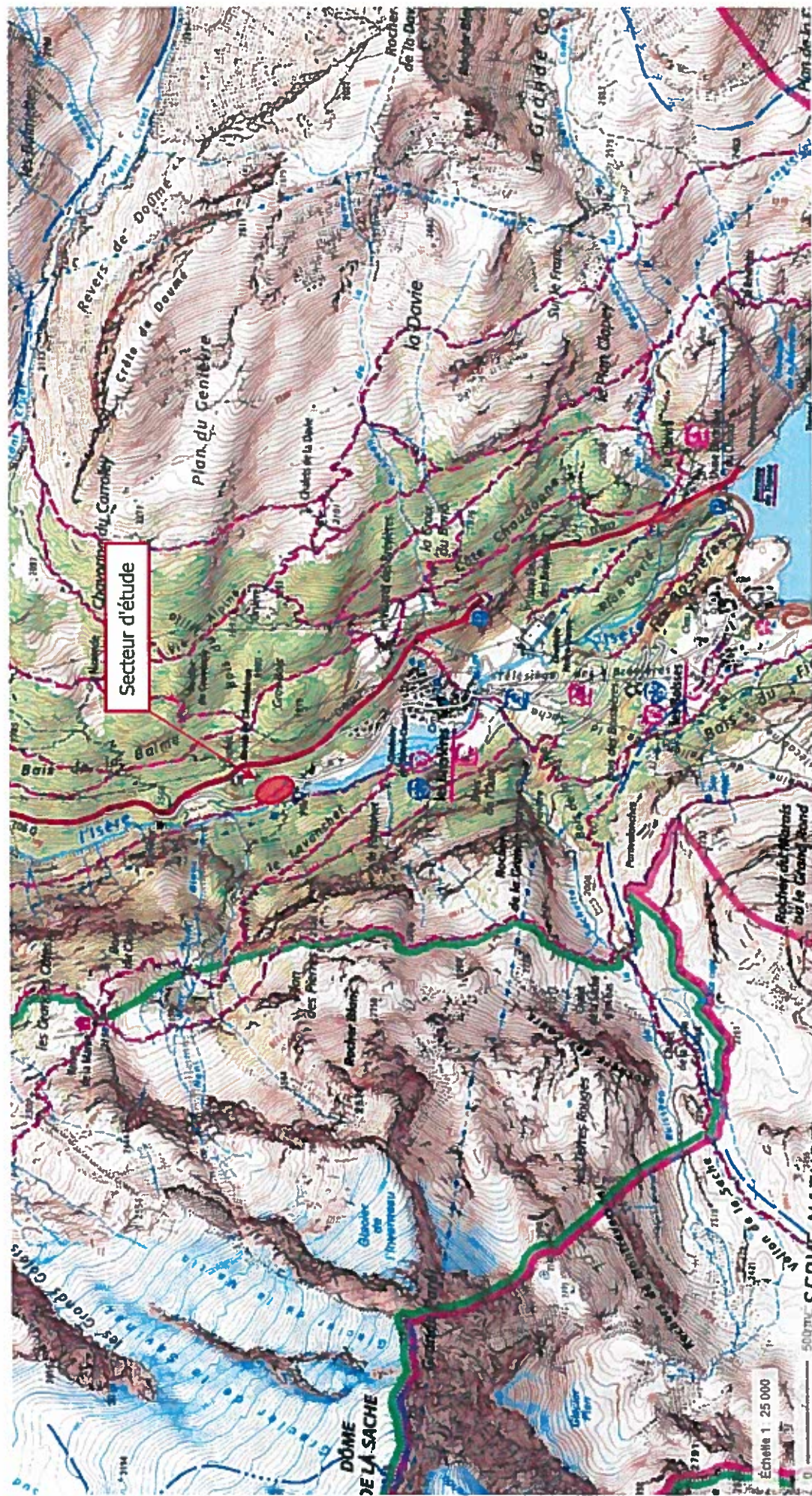
ANNEXE 2 - Plan de situation (1/25 000)