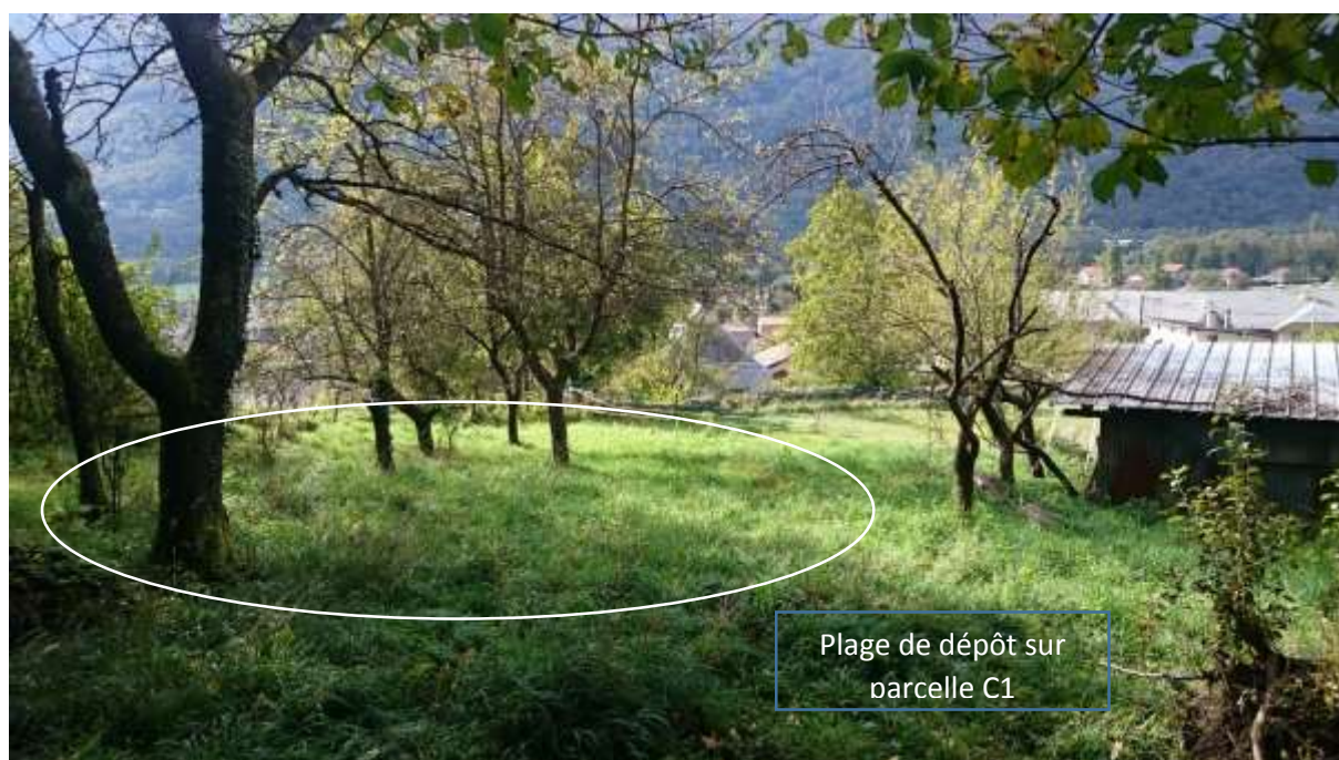
Vue sur la future plage de dépôt (parcelle C1)