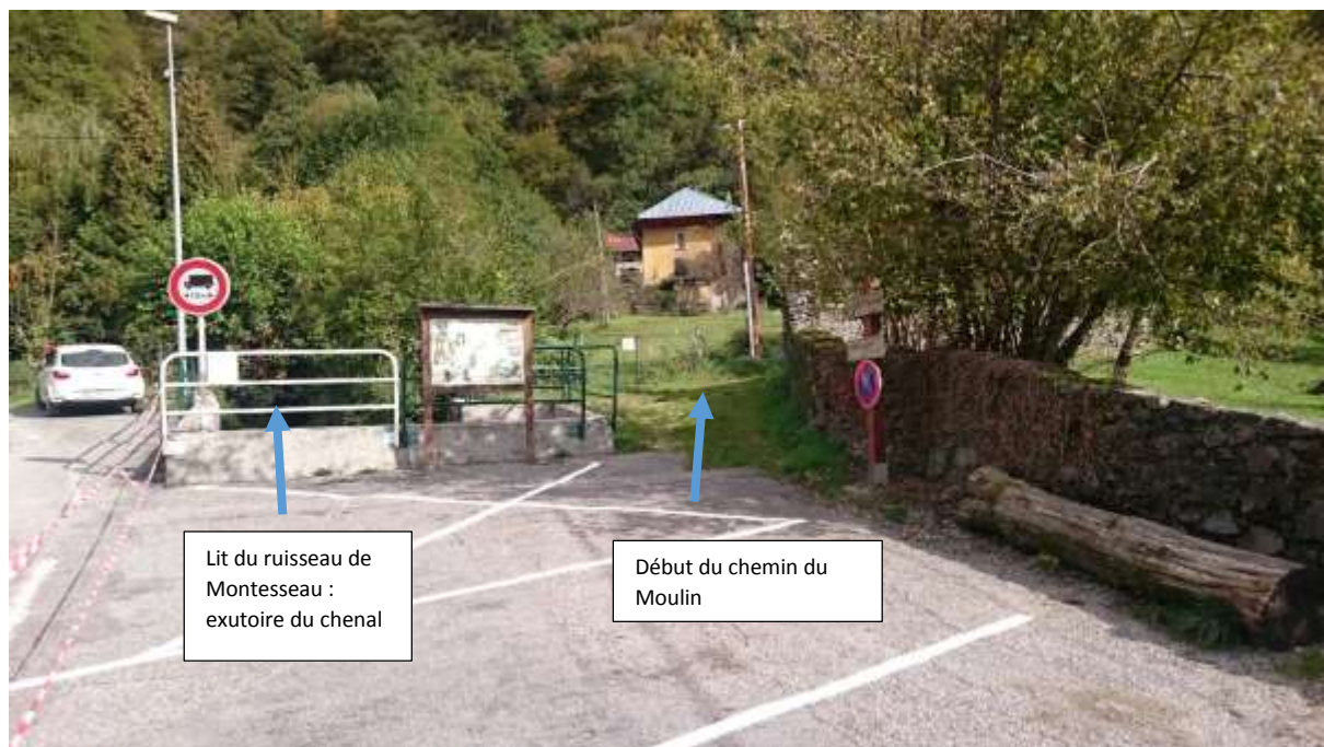
Vue du début du chemin du Moulin et du ruisseau des Côtes s'écoulant sous la voirie