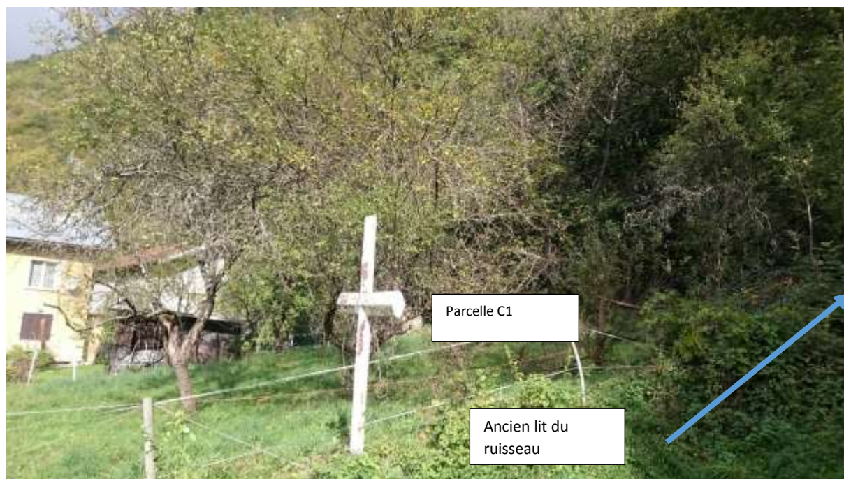
Vue sur l'emplacement de la plage de dépôt (parcelle C1) et sur l'ancien lit du ruisseau