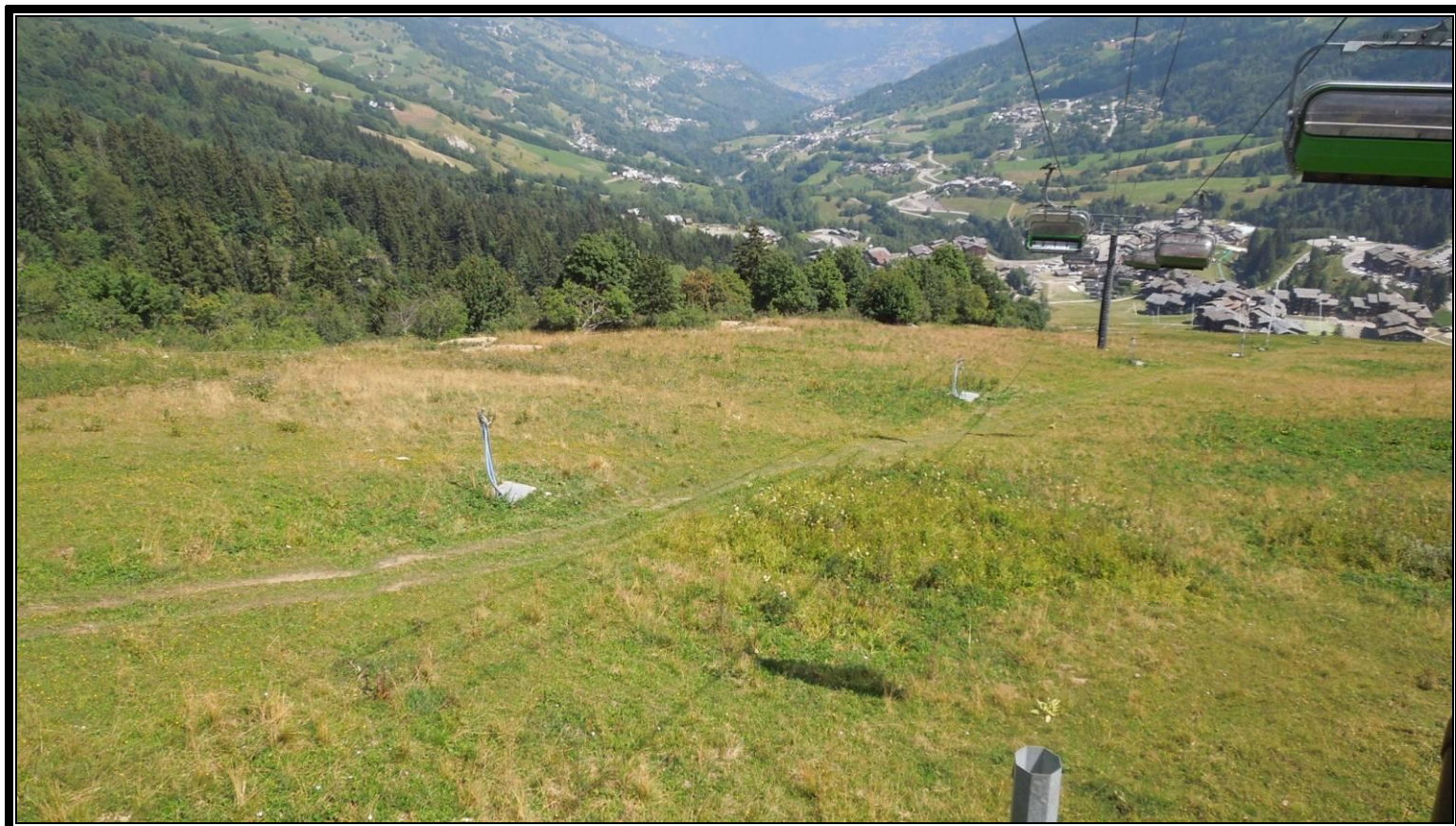
Photographie 3 : Gare amont télési Stade 1 et gare aval télési Stade 2