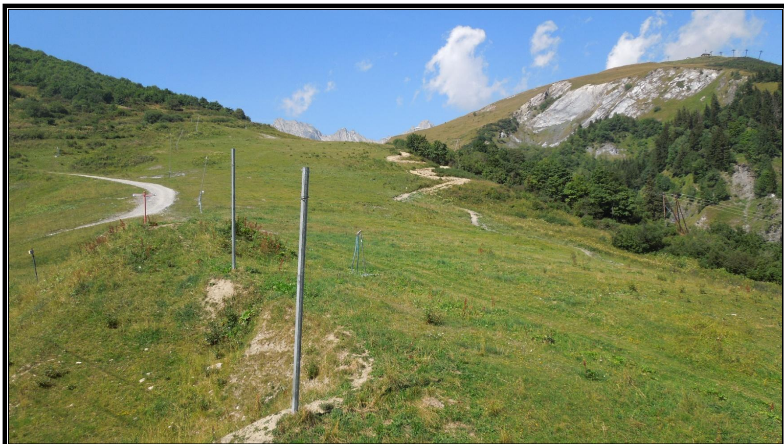
Photographie 4 : Gare d'arrivée - Télési Stade 2