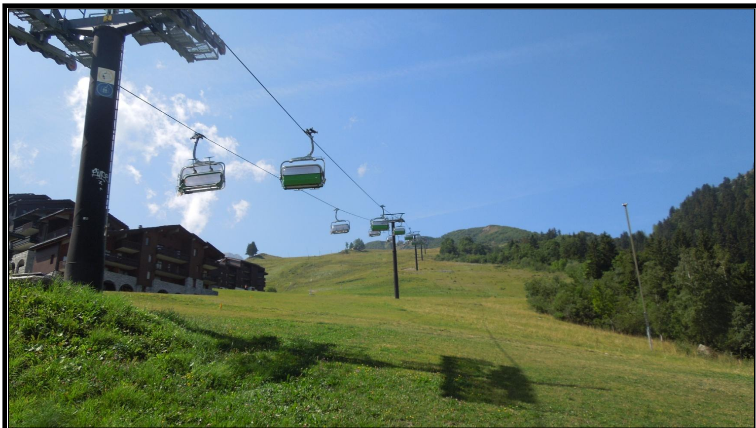
Photographie 2 : Gare aval – Télésiade 1