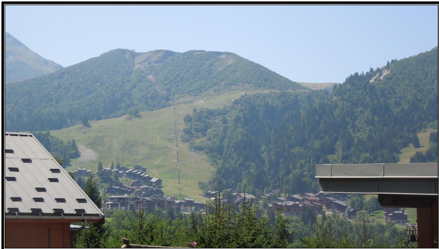
Photographie 1 : Vue d'ensemble