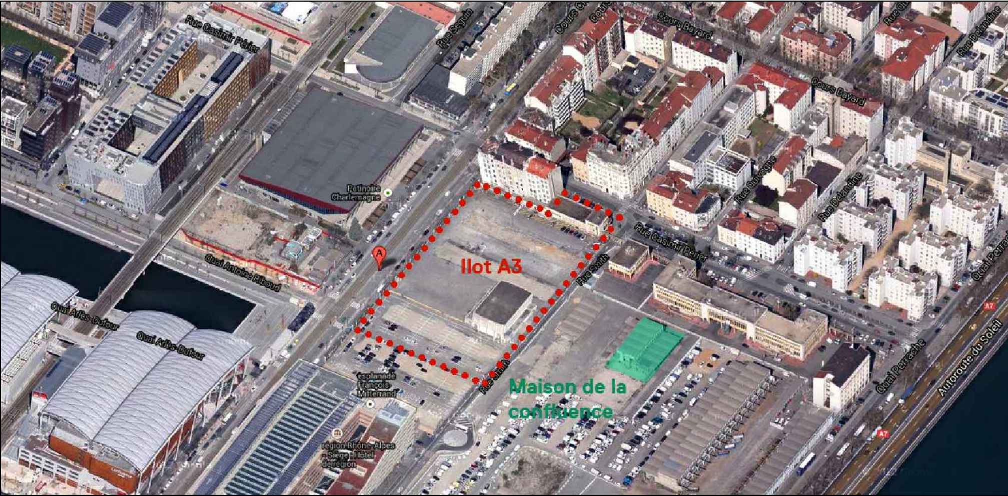
① Vue aérienne du site