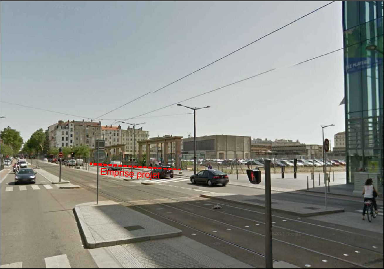
③ Vue depuis le Sud du Cours Chalmagne