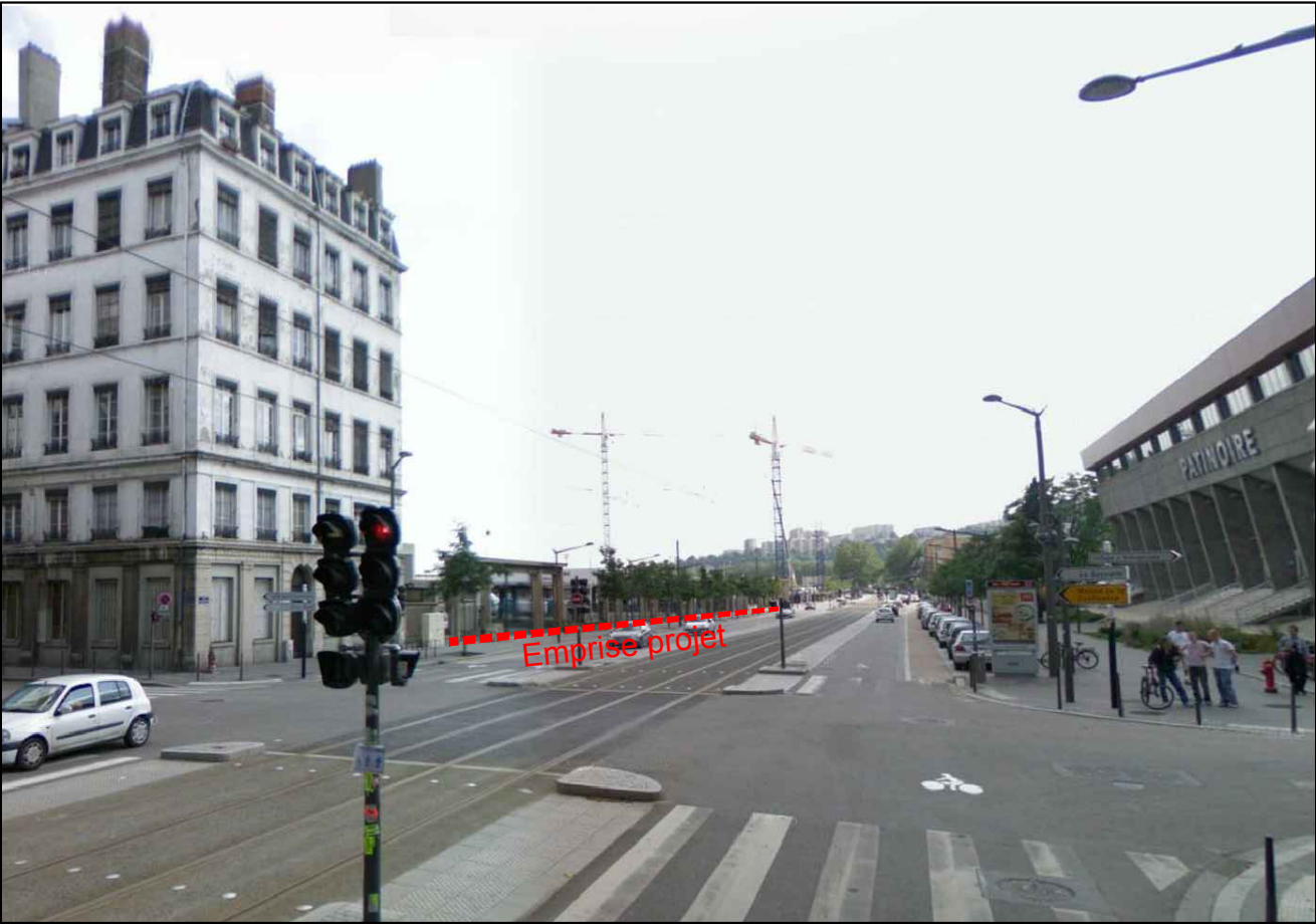
② Vue depuis le Nord du Cours Chalmagne