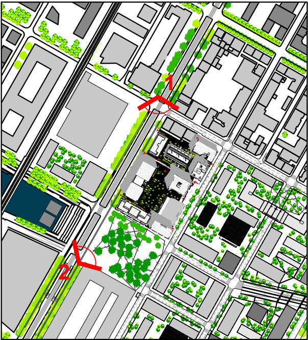
Plan de repérage échelle 1/5000 ème