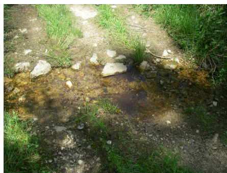
Petit écoulement sans nom vers « Creux du Fayant » où doit être installé une buse d'environ 6 m.. Le débit est très faible à 20 m des sources.