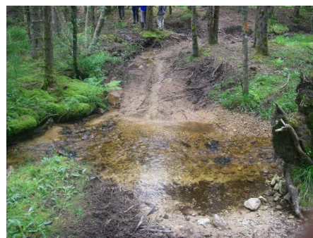
Passage à gué du Ban où doit être installer un pont cadre d'une largeur comprise entre 2 et 2.5 m et sur une longueur d'environ 6 m.