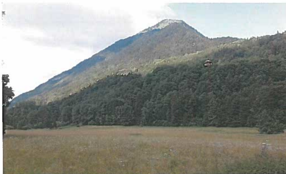
Talweg traversé 2 fois dans le projet