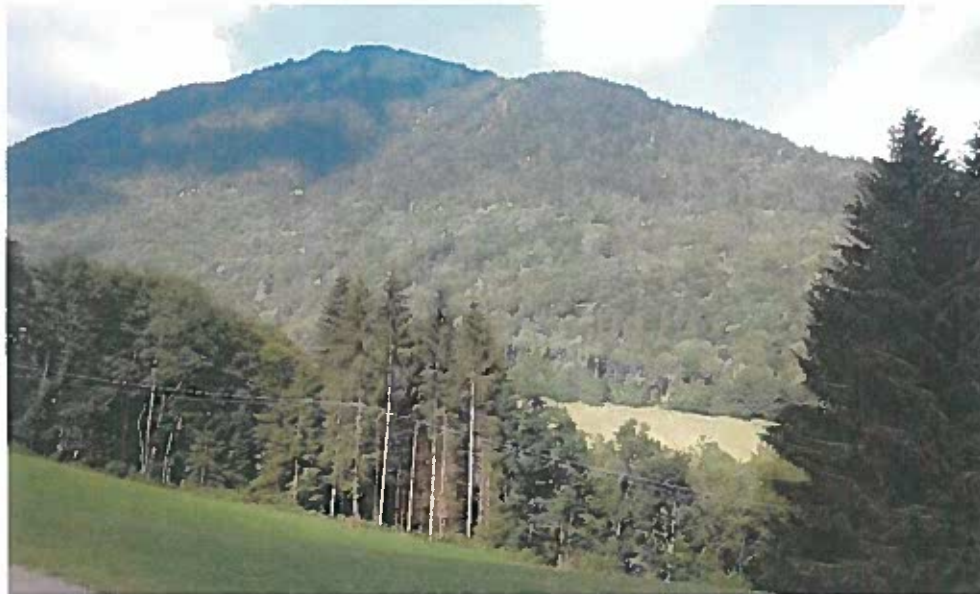
Photos prises le 19 juin au niveau de l'abbaye de Tamié : l'ouverture de route de 2016 est invisible