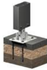
Type d'ancrage : pieux en tiges torsadées (Image d'illustration - non contractuelle)

Données indicatives - non contractuelles