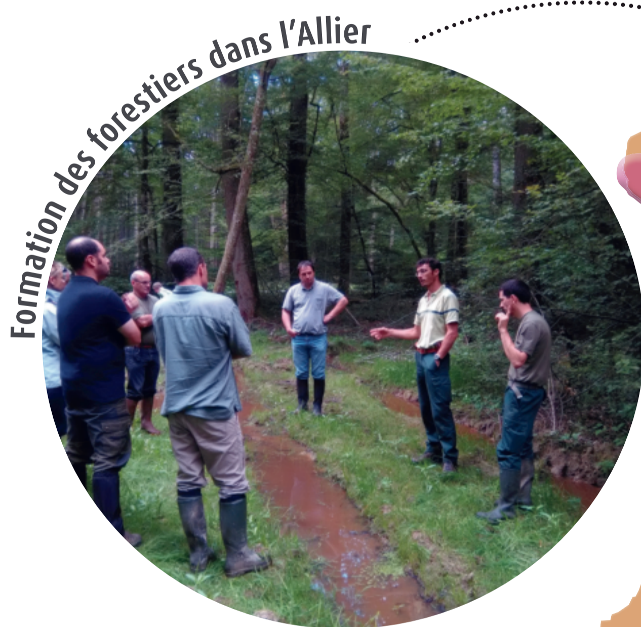
Formation des forestiers dans l'Allier

Grâce aux déclinaisons régionales du PNA Sonneur (PRA) et à la mobilisation de bénévoles, l'aire de répartition du sonneur a été actualisée sur l'ensemble de la nouvelle région. D'autres outils ont également été produits comme une check-list des mesures compensatoires et de gestion recommandées.