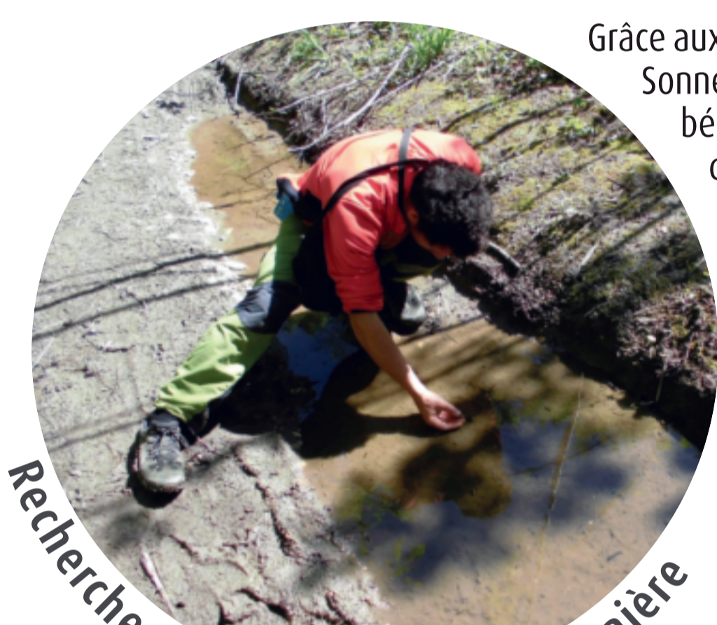
Recherche de Sonneur dans une ornière

Grâce aux déclinaisons régionales du PNA Sonneur (PRA) et à la mobilisation de bénévoles, l'aire de répartition du sonneur a été actualisée sur l'ensemble de la nouvelle région. D'autres outils ont également été produits comme une check-list des mesures compensatoires et de gestion recommandées.