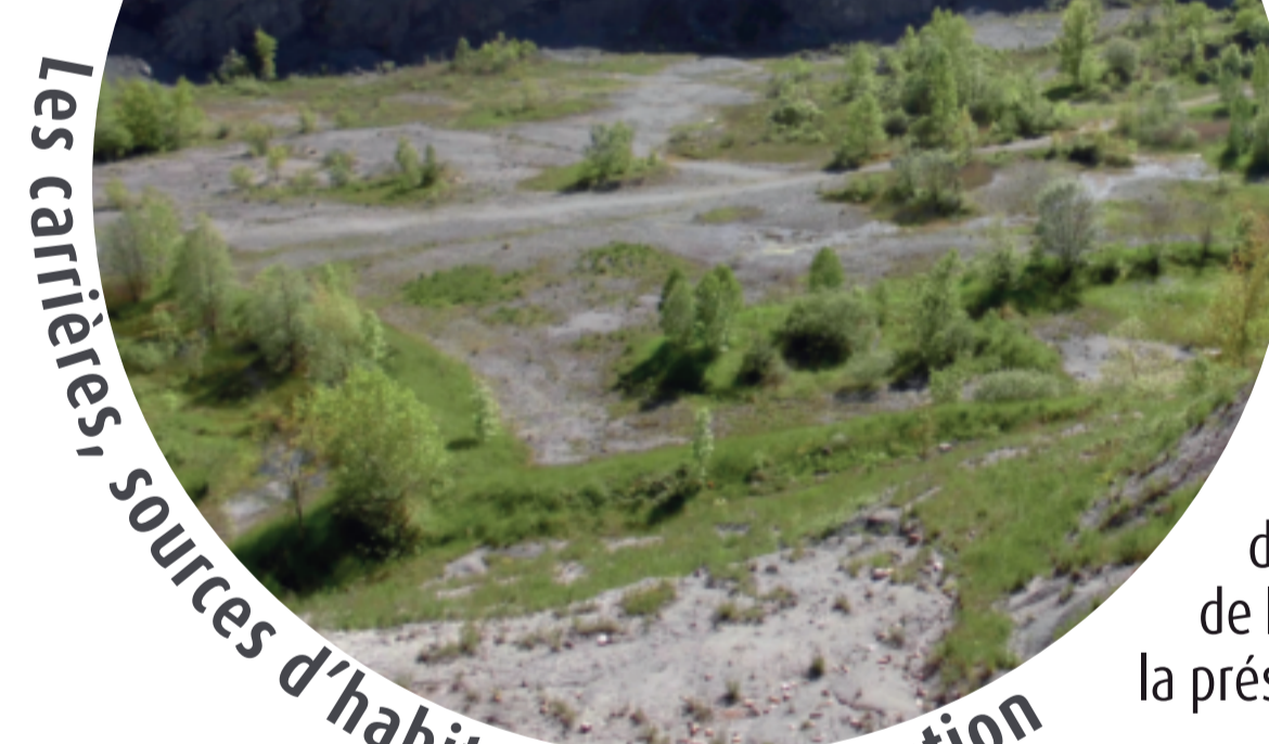
Les carrières, sources d'habitats de substitution

Un partenariat avec l'Union Nationale des Industries de Carrières et Matériaux de construction (UNICEM) Rhône-Alpes et des accompagnements locaux auprès de carrières ont abouti à une appropriation de l'enjeu Sonneur et une réelle avancée dans la préservation de l'espèce au sein des carrières.