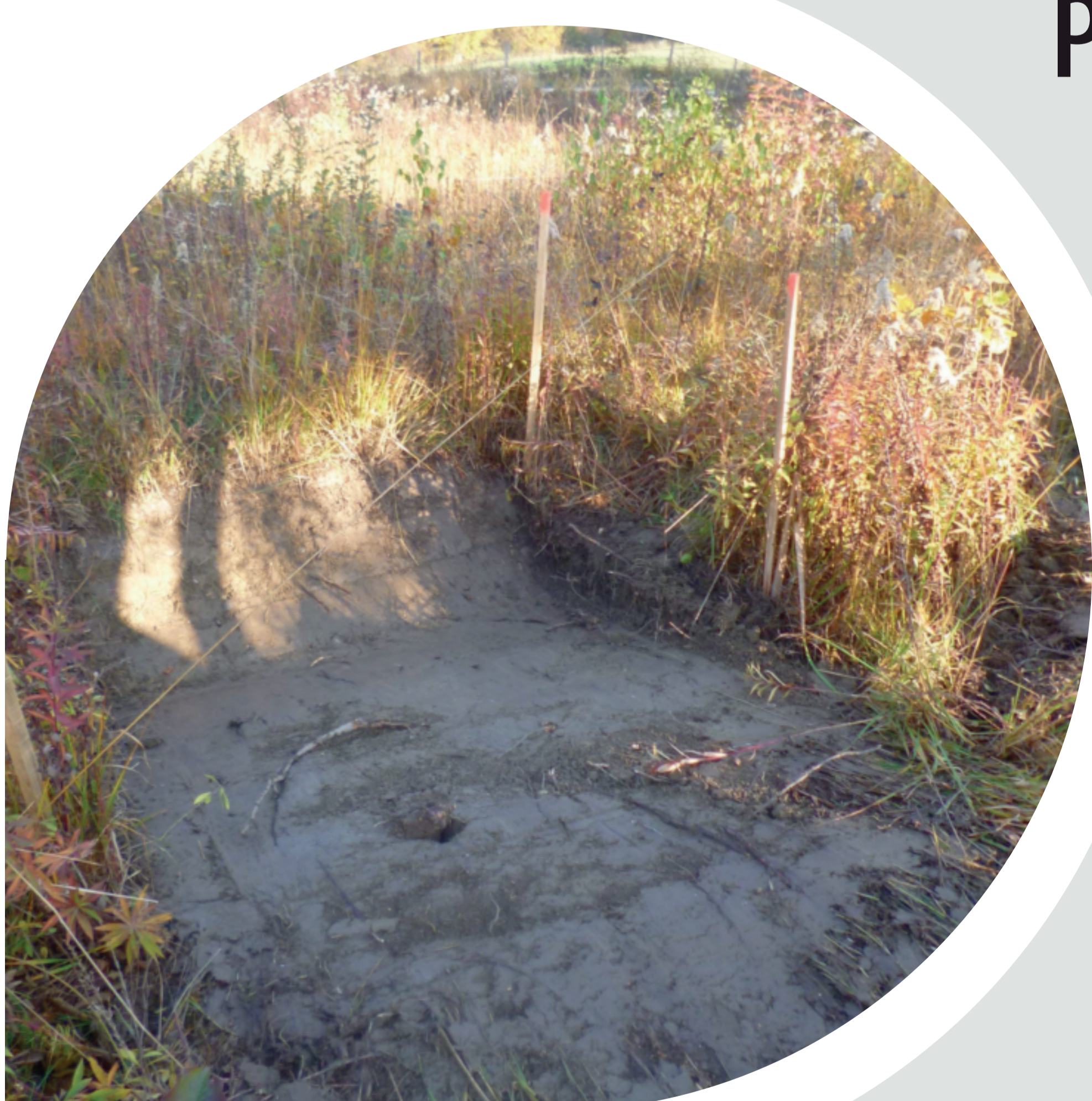
La création de mares, exemple de mesure compensatoire