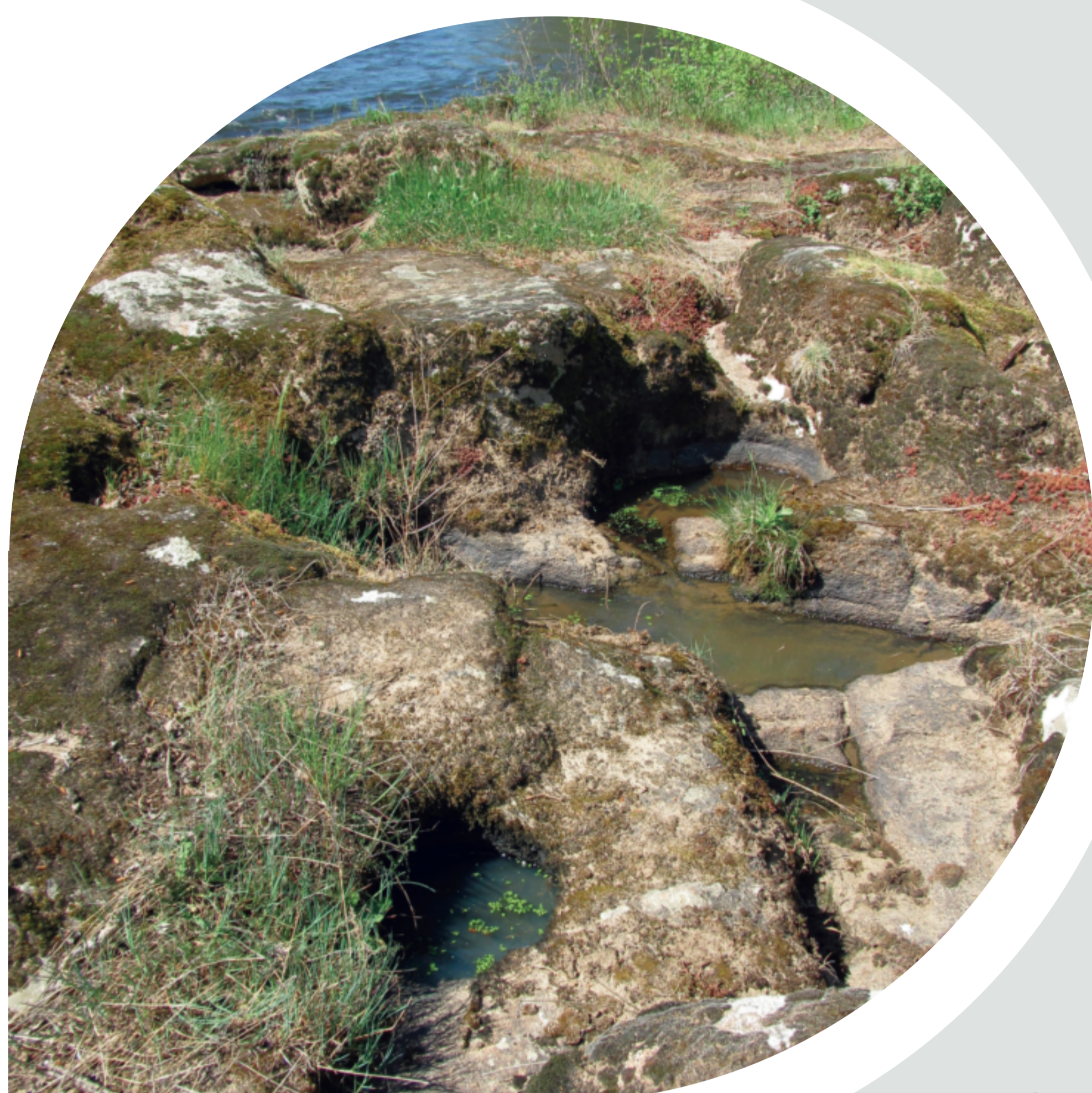
Vasques rocheuses de l'Allier, exemple d'habitat de reproduction du Sonneur