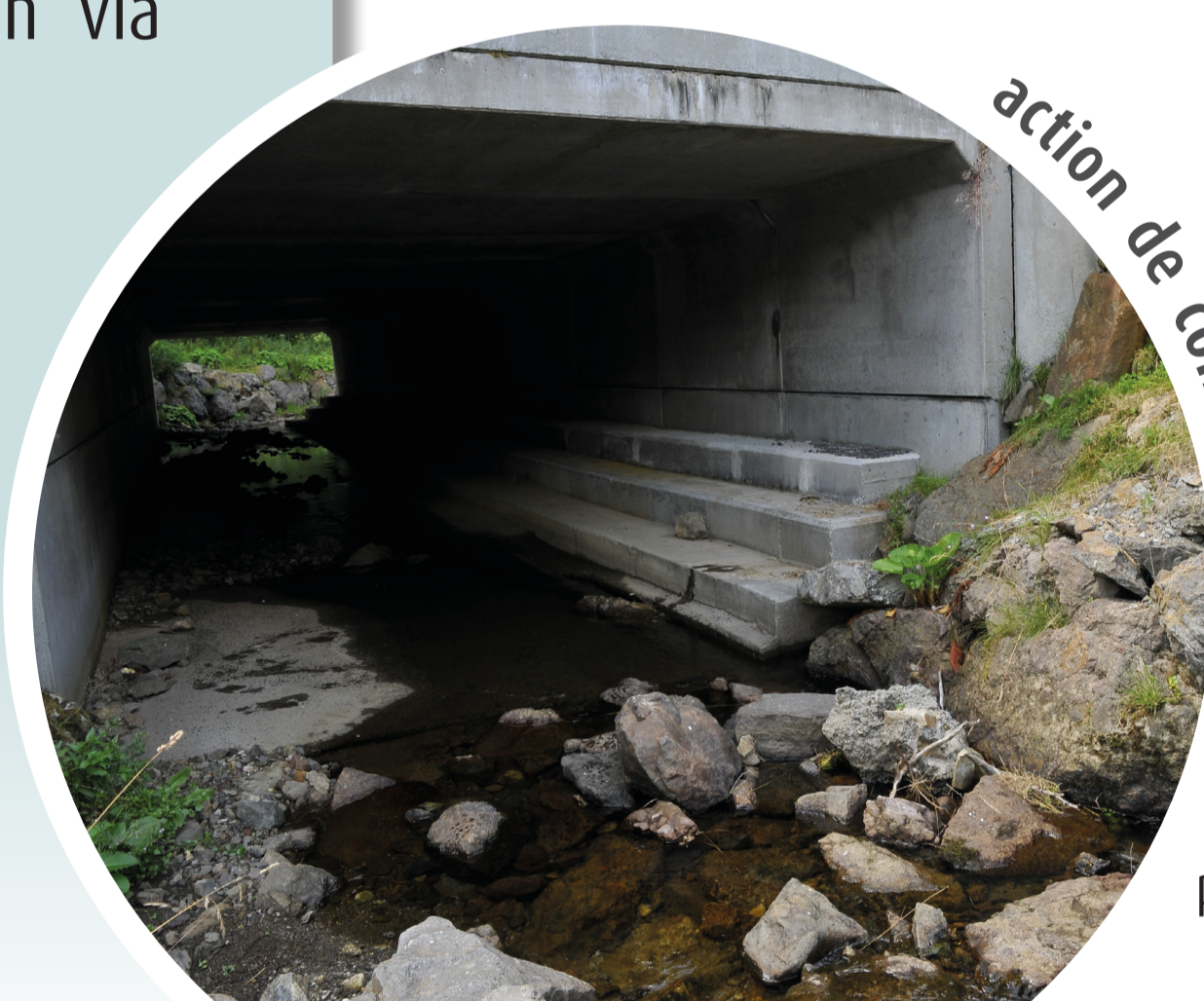
action de conservation

équipement des réseaux routiers par des passages adaptés