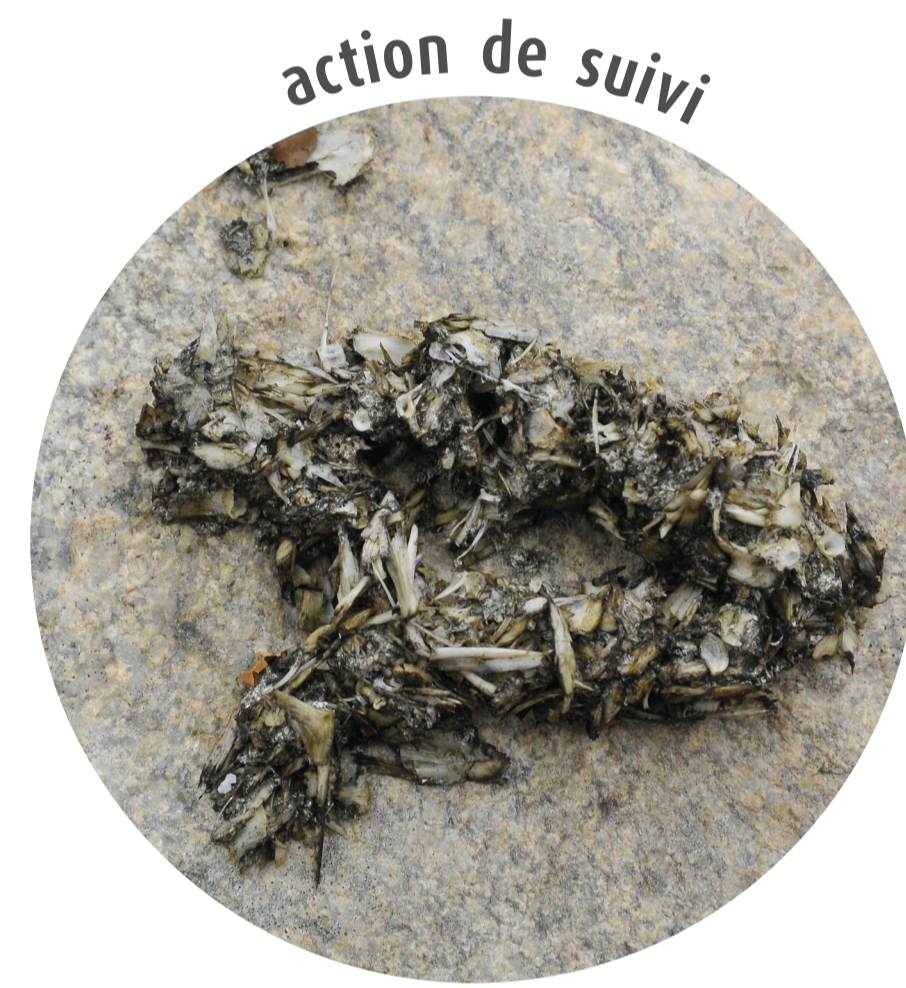
action de suivi

l'épreinte de la loutre est caractéristique, c'est le principal outil d'étude de l'espèce sur le terrain