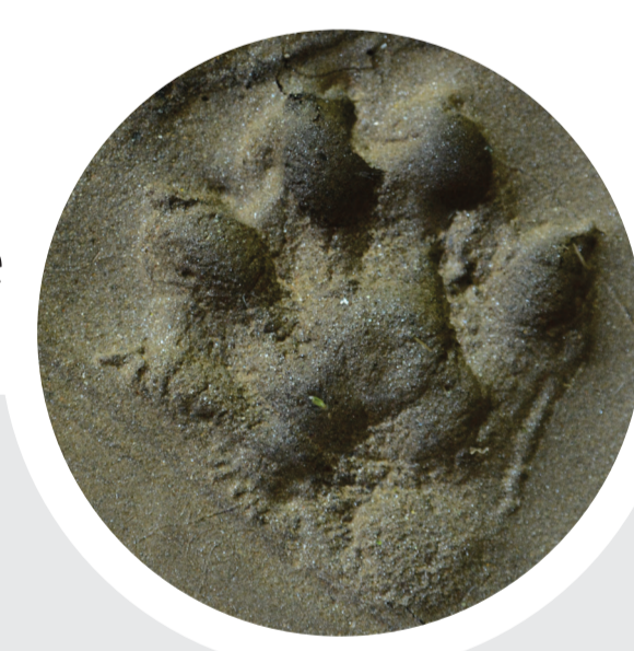
empreinte de la loutre

en cas de prédation par la Loutre, les installations aquacoles (piscicultures et étangs) peuvent être protégées