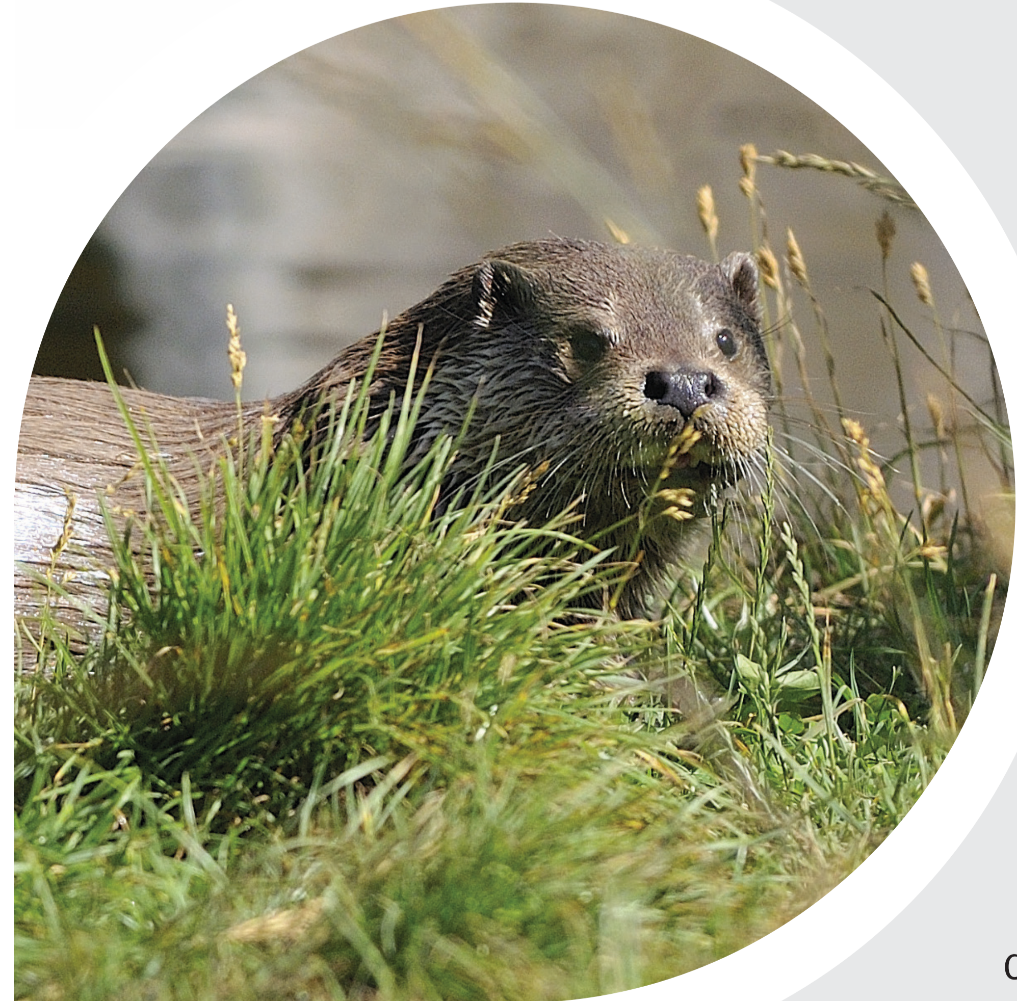
Petites oreilles et grandes vibrisses !