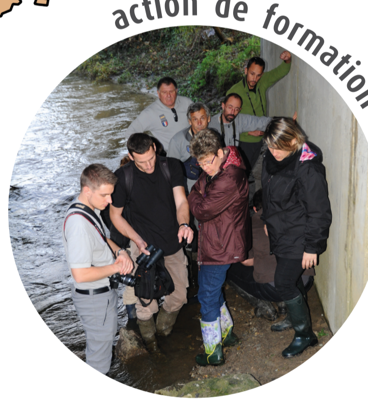
action de formation

apprentissage des indices de présence de la loutre puis du suivi sur le terrain