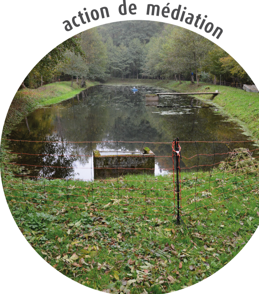
action de médiation

l'épreinte de la loutre est caractéristique, c'est le principal outil d'étude de l'espèce sur le terrain