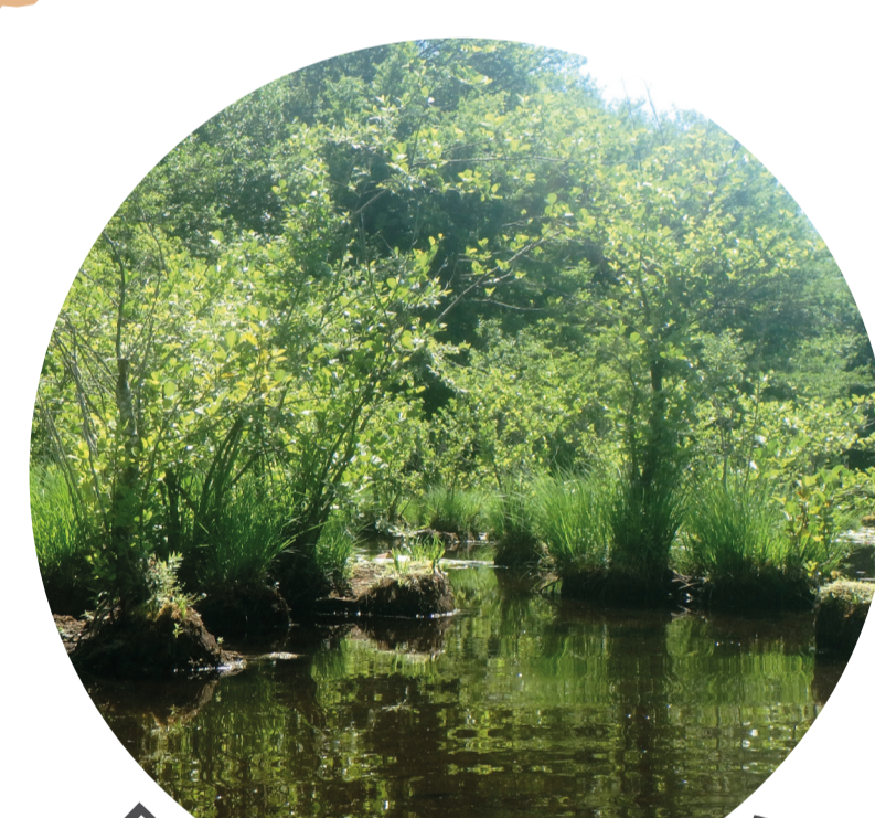
Etang de Malserved (38)

Aire de répartition de l'espèce