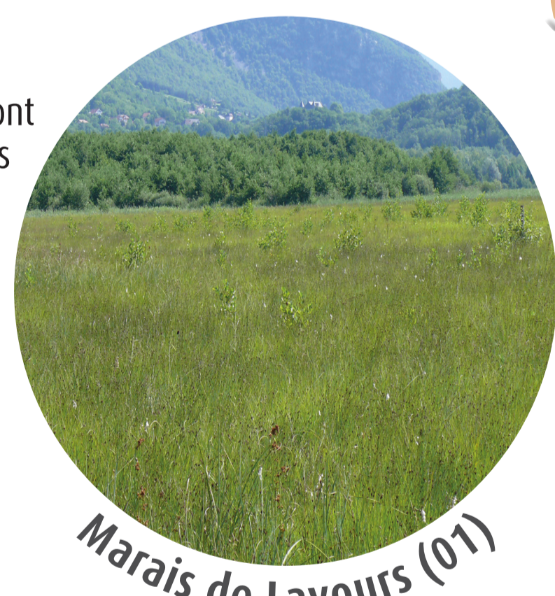
Marais de Lavours (01)

Les plus grandes populations sont préservées par des réserves naturelles nationales : Le marais de Lavours (01) et les tourbières du Grand-Lemps (38)