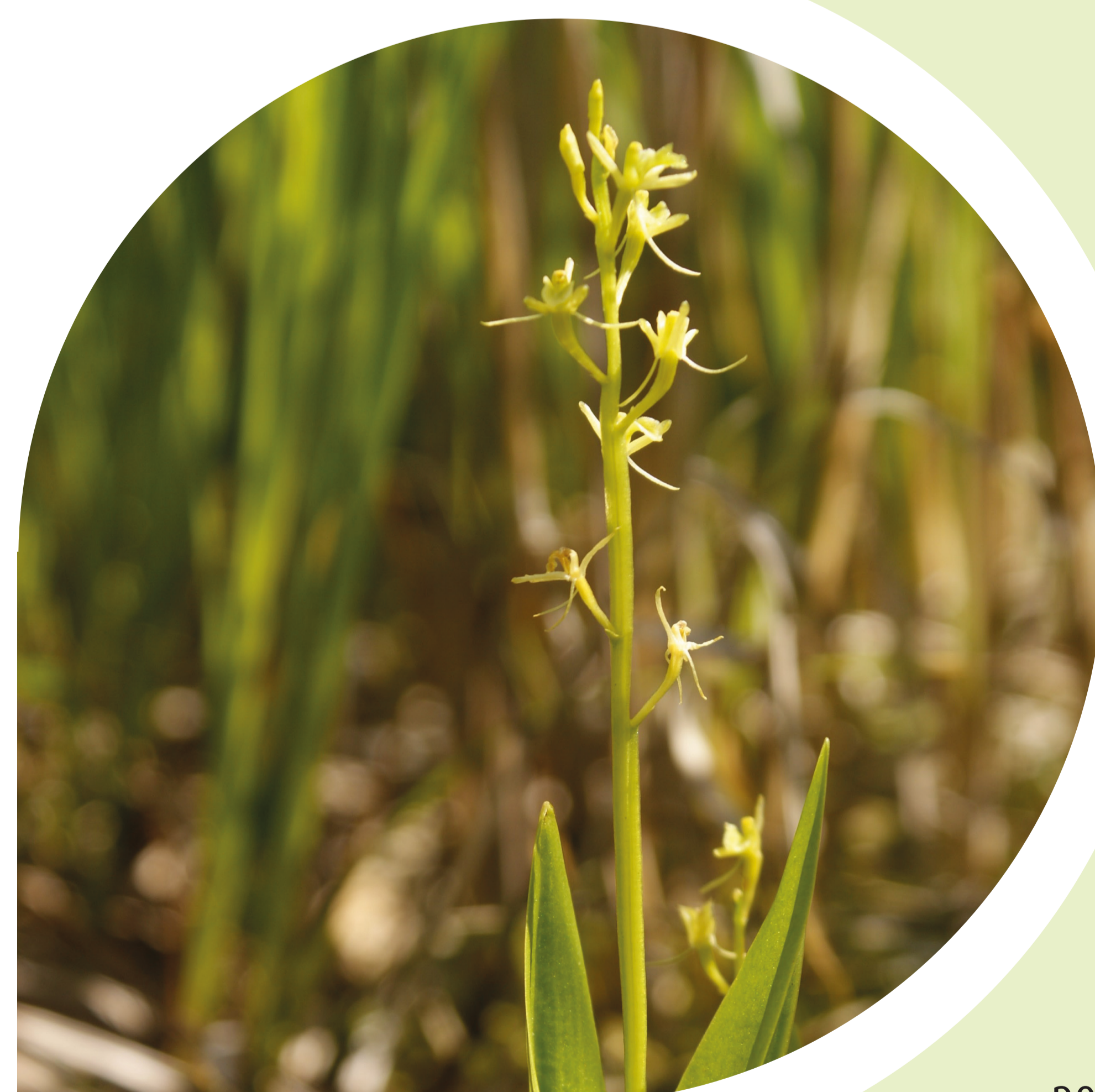
Le liparis petite orchidée discrète ...