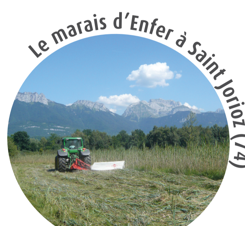
Le marais d'Enfer à Saint-Jorioz (74)

Exemple de gestion d'une parcelle accueillant du Liparis, par fauche et exportation