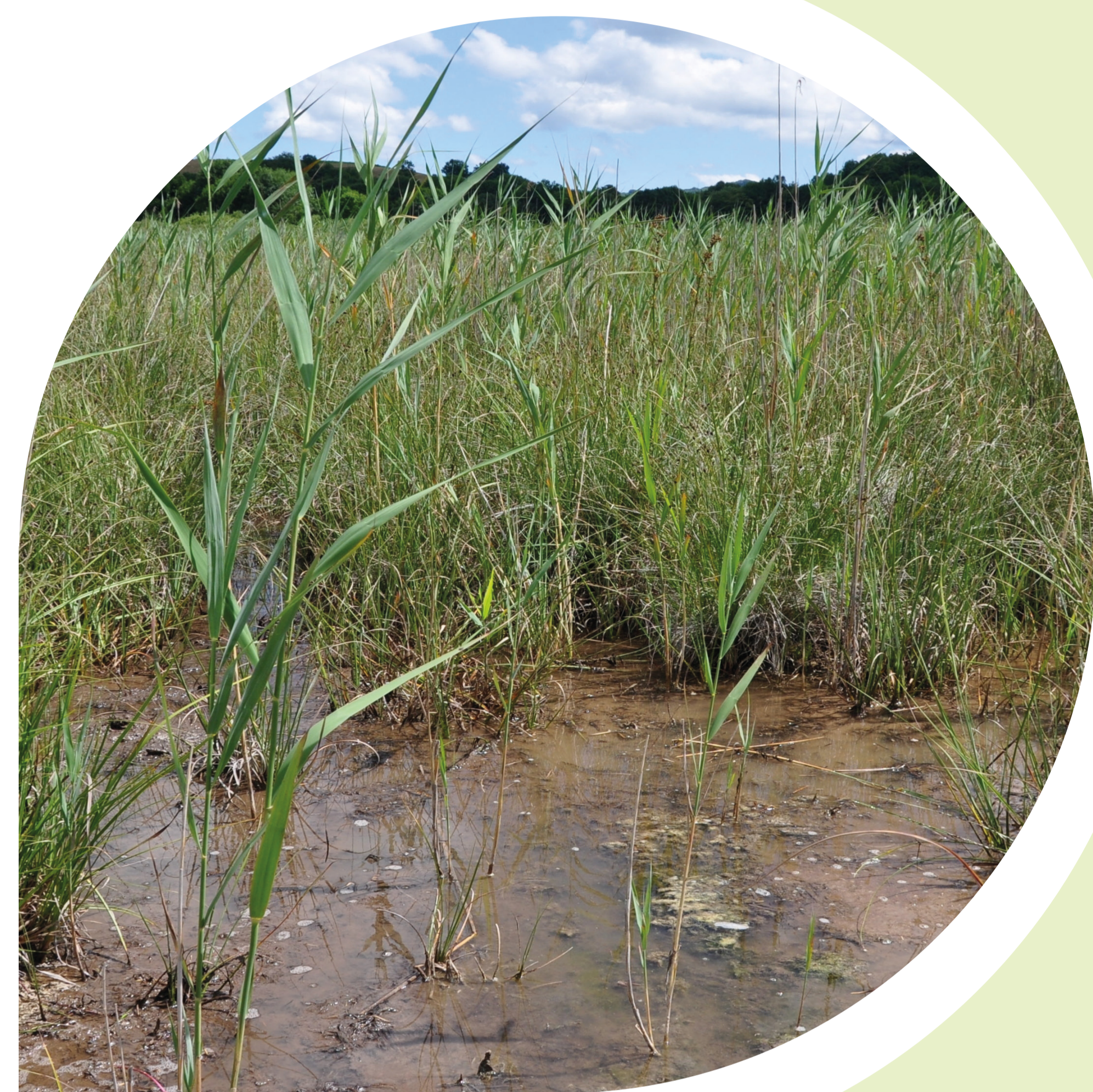
Tourbières alcalines de la EN du Grand-Lemps (38) : un habitat favorable à l'espèce

Au sein d'une même population, le nombre d'individus visibles est très variable d'une année à l'autre ; le Liparis est ainsi considéré comme une espèce à éclipse. Ces variations d'effectifs dépendent de nombreux facteurs. Les pseudobulbes peuvent aussi se déplacer à la surface de l'eau par flottaison !