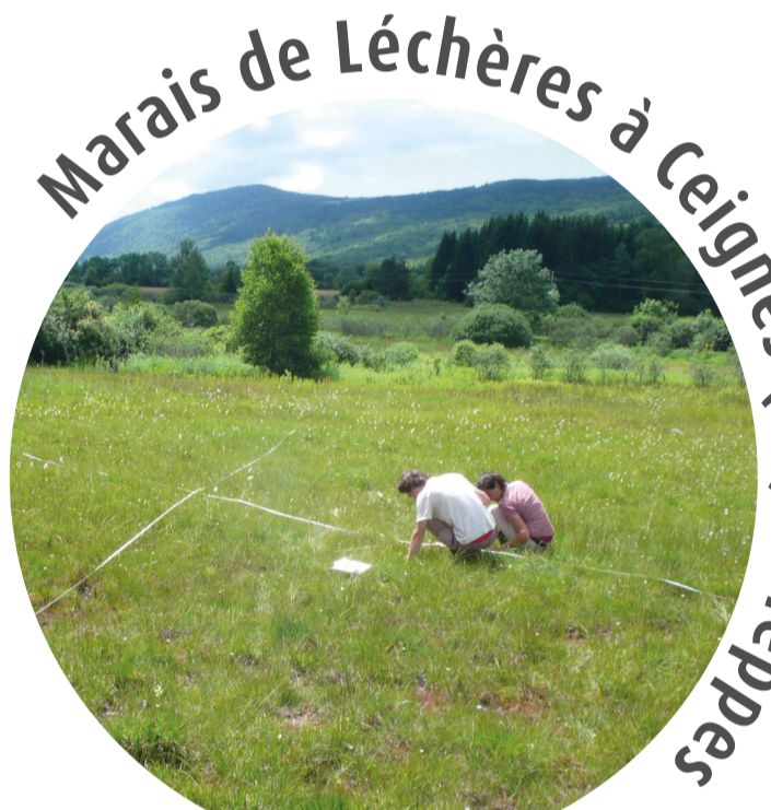
Marais de Léchères à Ceignes (01) et Teppes

Suivi par transects de 14 populations (participant à l'échantillon national) par les conservatoires d'espaces naturels, les associations, les réserves naturelles... Exemple de suivi du Liparis dans l'Ain