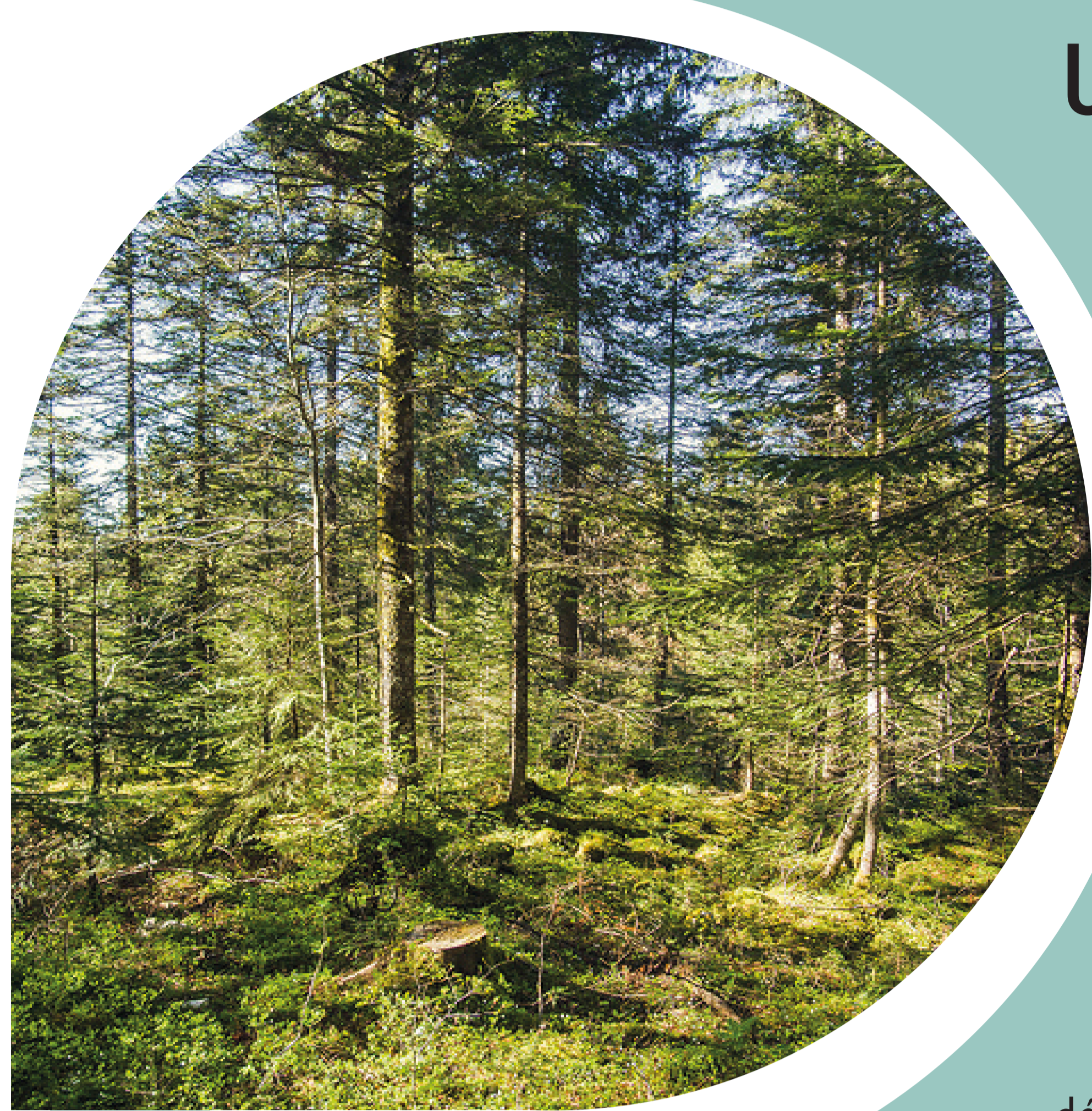
Habitats typiques de l'espèce dans la forêt de Champfremier (01)