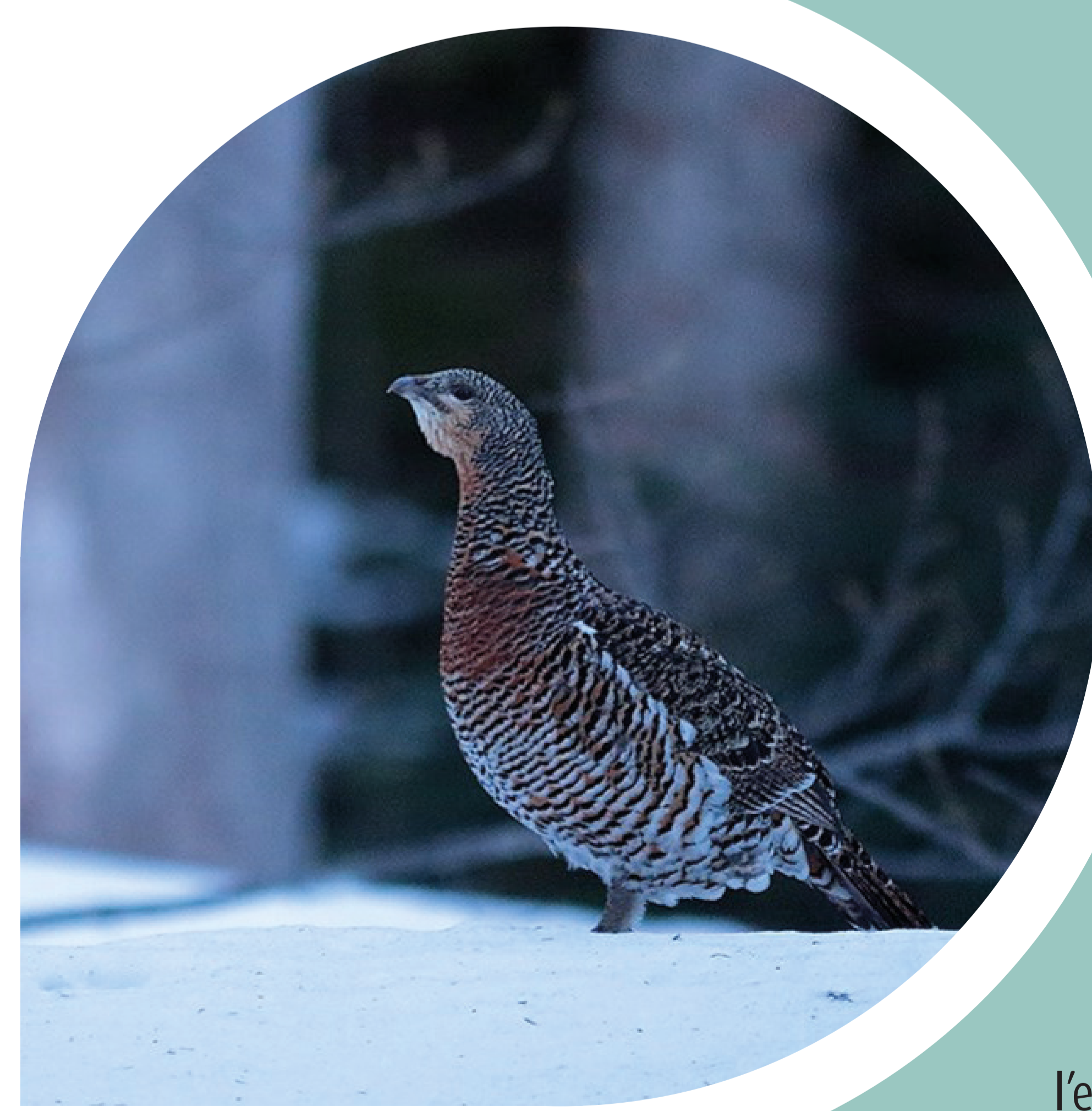
Très sensible, la poule tétras peut abandonner son nid en cas de dérangement

Le suivi génétique, coordonné par la RNN de la Haute-Chaine du Jura, permet d'améliorer la compréhension de l'espèce et de ses besoins