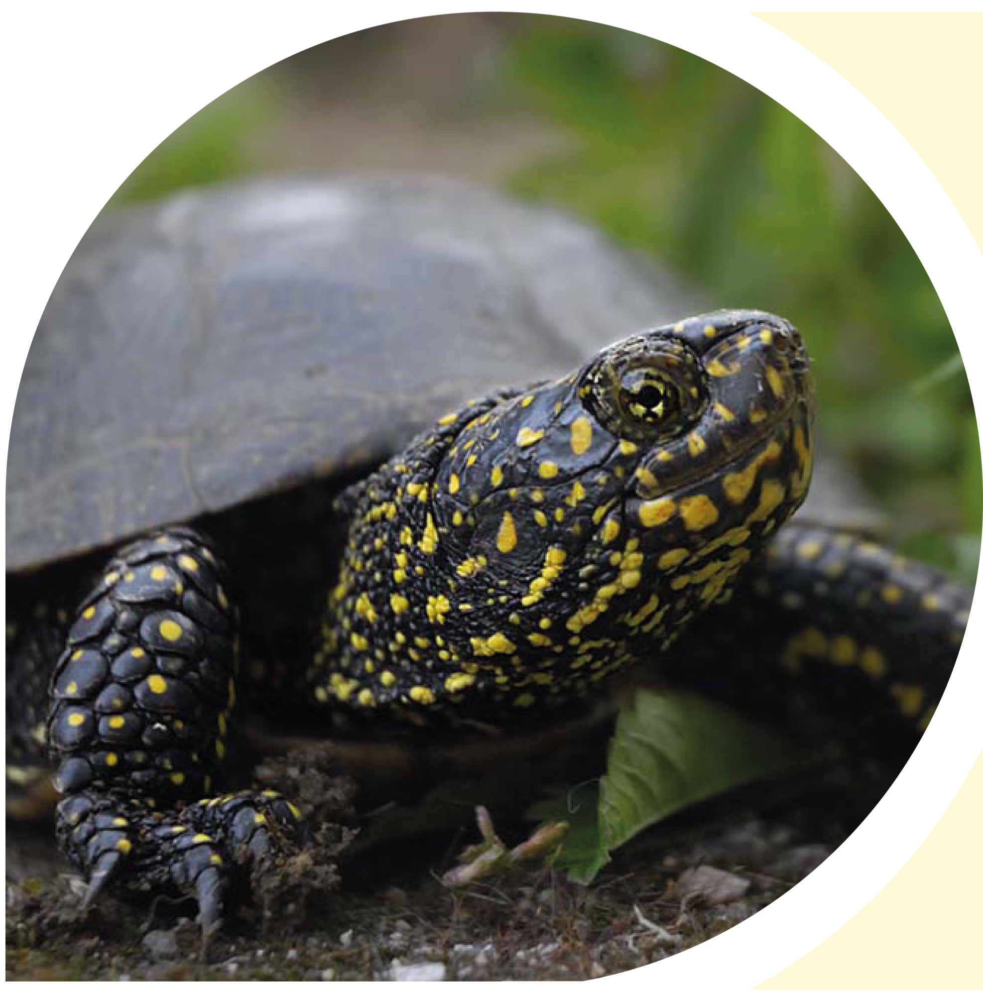
Signe distinctif : tête, cou, pattes et queue noirs ponctués de tâches jaunes !

Malgré une disparité entre l'Auvergne et Rhône-Alpes quant à la prise en compte de cette espèce patrimoniale, en termes de connaissance notamment et de déploiement des politiques environnementales (Natura 2000, ...), les 1ères déclinaisons du plan national d'actions ont concouru à une homogénéisation des enjeux et axes d'interventions, à poursuivre désormais en synergie. Enjeux : • faire connaître et prendre en compte son statut et ses besoins, • renforcer sa protection et celle de ses habitats, • poursuivre les réintroductions en cours. Actions : • protéger et entretenir les milieux aquatiques occupés, • identifier, protéger et faire adopter une gestion adaptée des sites de pontes, • restaurer des connexions sécurisées entre les sites utilisés (traversées de routes, ...).