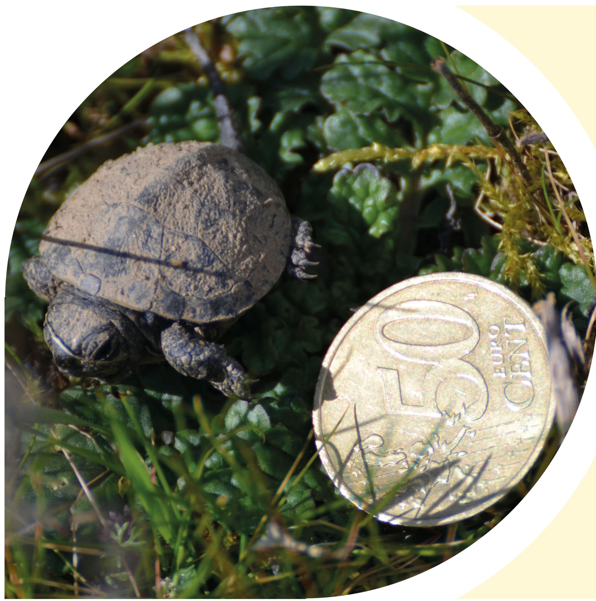
Émergent sorti de l'œuf, petite tortue à la carapace encore molle !