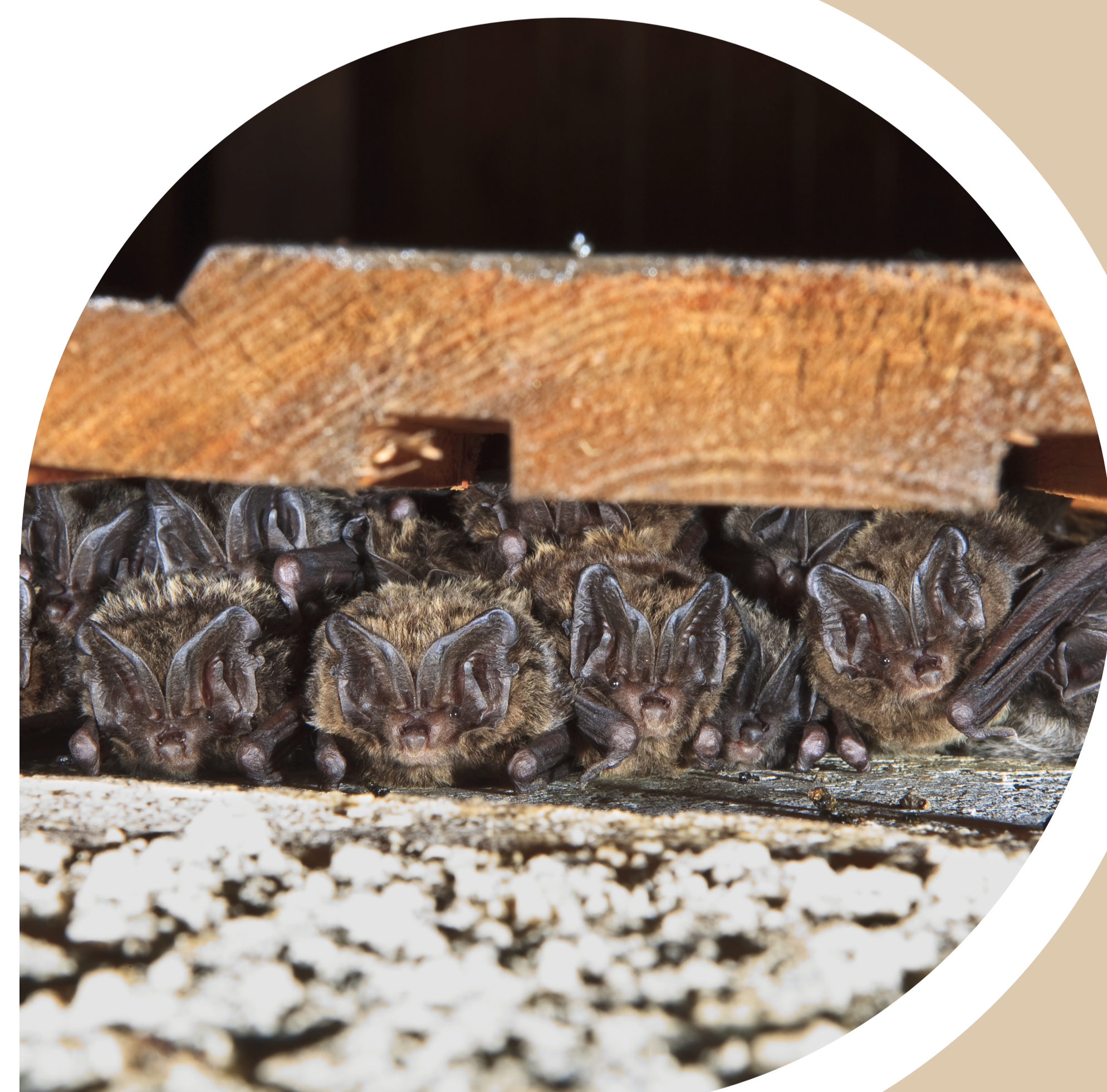
Gîte d'été d'une colonie de Barbastelle : un petit espace, contre du bois transformé ou non, est recherché !

Enfin, la sensibilisation doit être le fil conducteur de l'ensemble des actions et est certainement la clé de leur réussite.