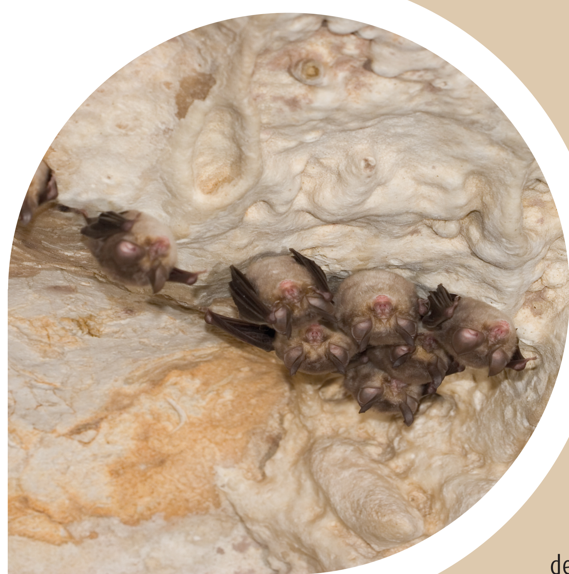
Colonie de Rhinolophes