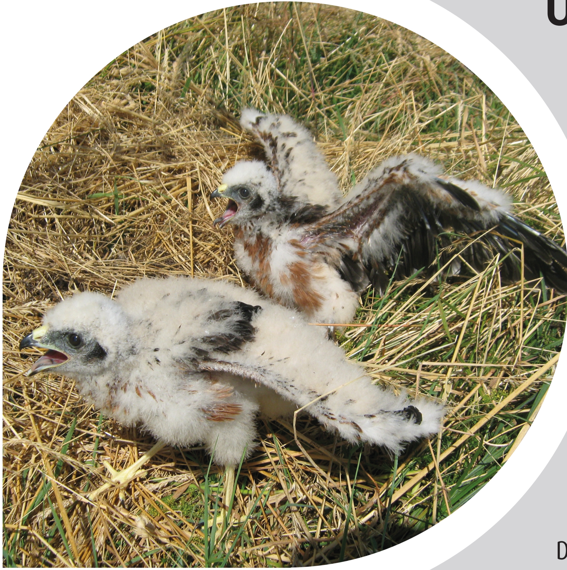
Juveniles de busard cendré au sol

le saviez-vous ? Si les actions de protection actuelles cessaient, l'espèce disparaîtrait probablement en moins de 20 ans de France.