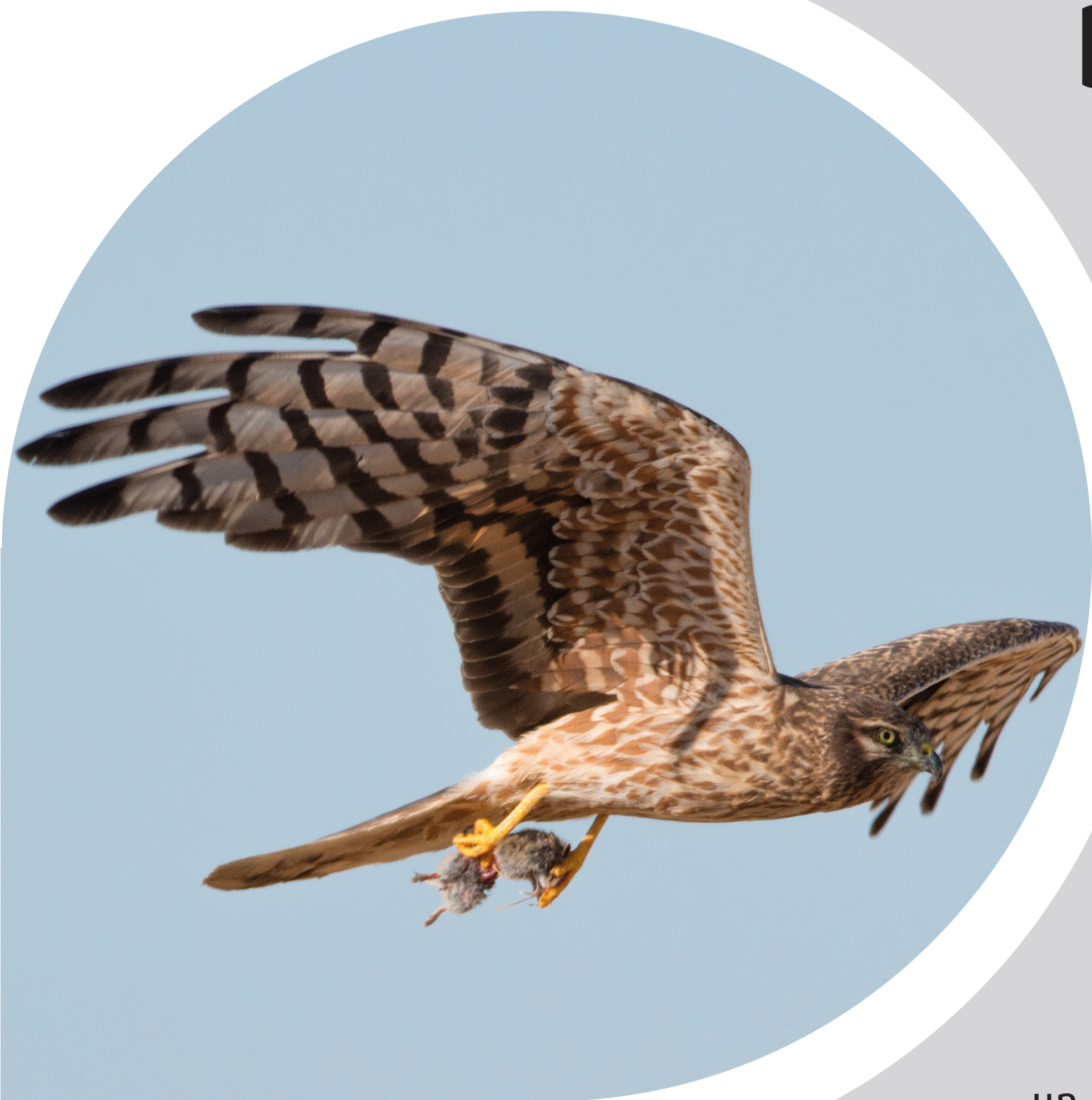
Femelle transportant une proie

La restauration et préservation des milieux naturels mais aussi des friches au sein des plaines agricoles est une condition à la survie des busards et plus globalement, de la biodiversité.